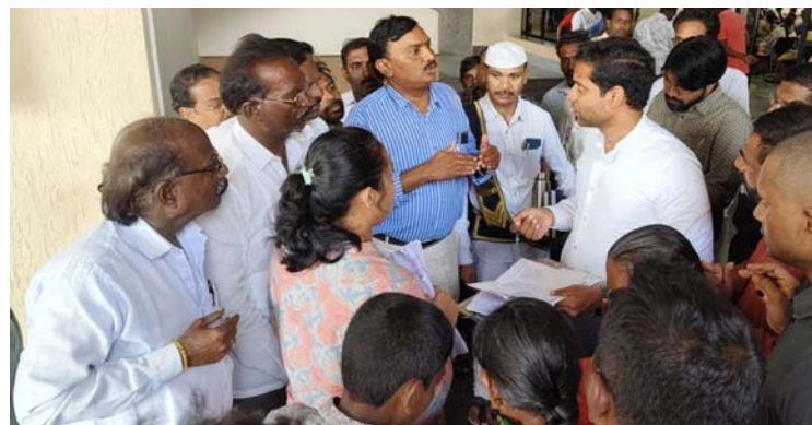
ఖమ్మం/ తల్లాడ జూలై 5 (అక్షరం న్యూస్)