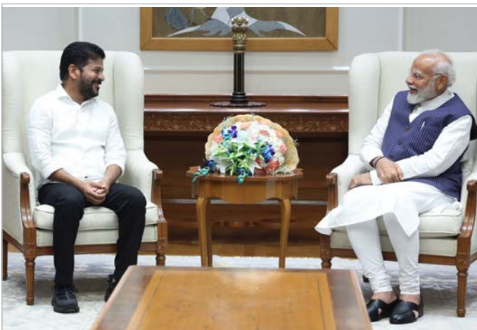
ఆంధ్ర ప్రదేశ్ లో నారా చంద్రబాబు నాయుడు నరేంద్ర మోదీని సత్కరిస్తున్నాడు.