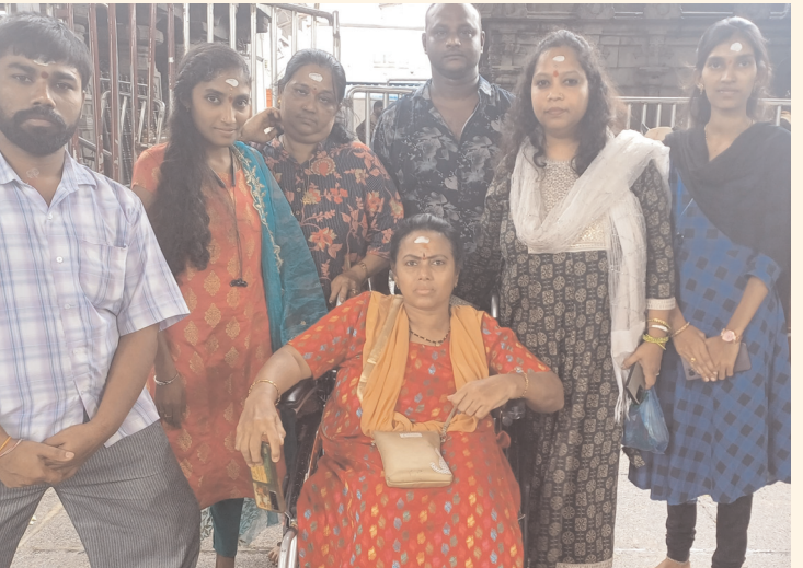
రాజన్న సినిల్/వేములవాడ, జూలై - 26 (అక్షరం స్టూన్):