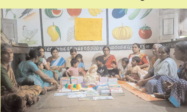
చొప్పదండి/ కరీంనగర్, జూలై 26 (అక్షరం స్పాస్)