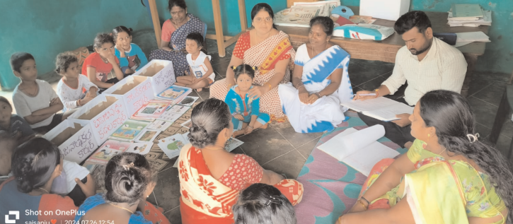
చొప్పదండి/ కరీంనగర్, జూలై 26 (అక్షరం స్పాస్)