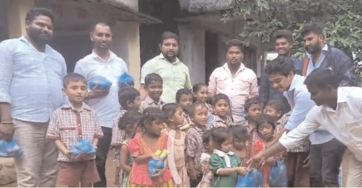
మహబూబాబాద్ జిల్లా కొత్త గూడ జూలై 26 (అక్షరం స్టూన్)

కొత్తగూడ లో ఘనంగా నిర్వహించిన యాత్ కాంగ్రెస్ శ్రేణులు