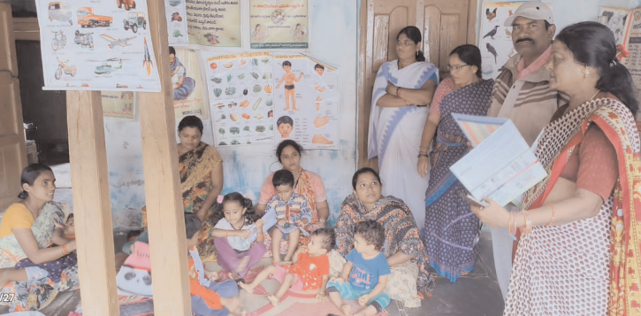
చొప్పదండి/ కరీంనగర్, జూలై 26 (అక్షరం స్పాస్)