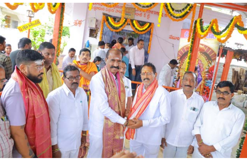
గురువు అనుగ్రహసేవలో రాజకీయ నాయకులు....!