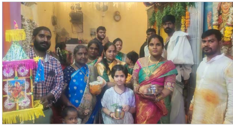
ఉంచడం ఘనమార్గం. ఈ కార్యక్రమంలో ఆలయ కమిటీ సభ్యులు పెద్ద ఎత్తున మహిళా భక్తులు తదితరులు పాల్గొన్నారు.

హైదరాబాద్, జూలై 21 (అక్షరం న్యూస్) సికింద్రాబాద్ సనత్ నగర్ నియోజకవర్గం బస్నీలాల్ పేట్ డివిజన్ పురాతనమైన మెట్ల బావి పక్కన సాక్షాత్తు వెలసిన మహిమగల దేవత శ్రీ నల్ల పోచమ్మ ఆలయంలో ఆలయ కమిటీ సభ్యులు ఆధ్వర్యంలో అంగరంగ వైభవంగా ఆషాఢమాస బోనాల జాతర ఉత్సవాలను ఘనంగా నిర్వహించారు. ప్రతి ఏడాది మాదిరిగానే అమ్మవారికి తెల్లవారుజామున వంచమ్మతాల అభిషేకం, కుంకుమార్చనతో అమ్మవారిని మేలుకొలిపారు. మహిళా మండలి పెద్ద ఎత్తున అమ్మవారికి బోనాలు, బ్యాండ్ భార్యతో పోతరాజుల విన్యాసాలతో సమర్పించారు. ఈసారి ప్రత్యేకంగా ఆలయవారి ఆలయ అలంకరణ ఎల్ఈడీ స్ట్రీప్లతో అమ్మవారి ప్రభా కాంతులను విరజిల్లే విధంగా అలంకరించడం ప్రత్యేక ఆకర్షణగా నిలిచింది. ఆలయ ఆవరణలో ఈసారి అమ్మవారి ప్రతిమను ఓడిబియ్యం పోయడానికి వచ్చిన మహిళా మణులకు అందుబాటులో