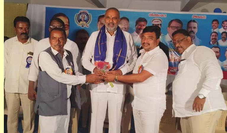
భారత రాజ్యాంగం ఇతర దేశాలకు అదర్శంగా