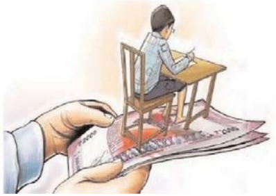
తీసుకోకపోవడం గమనార్హం. ఇంత నిర్లక్ష్యంగా

సరైన వసతులు లేకపోయినా ఉన్నట్లు అనుమతి పొంది అధికారులను మంచిగా చేసుకుని వారికి ఇచ్చే మామూళ్లను వాళ్లకు ఇస్తూ స్కూళ్లను నడిపిస్తున్నారు. అధికారులను నిలదీసిన వాళ్లకు అధికారులు మీరు ఎందుకు జైన్ అయ్యారు. ప్రైవేట్ సంస్థలు అంటే ఇలాగే ఉంటాయి మీకు ఇష్టమైతే ఉండండి కష్టమైతే మానేయండి అని నిర్లక్ష్యంగా వ్యవహరిస్తున్న వైసం కనిపిస్తుంది. అంతేగాని విద్యార్థులను రాసిరంపాన పెడుతున్న విద్యా సంస్థలపై ఏ రకమైన చర్యలు