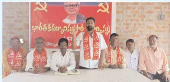
నాగర్ కర్నూల్ జిల్లా/తెలంగాణ/ జూన్ 12(అక్షరం న్యూస్):