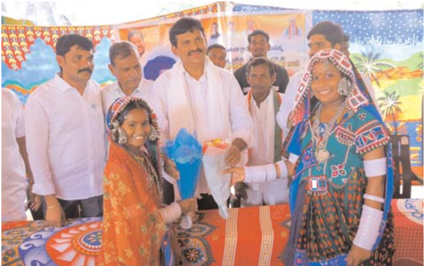
(మొదటి పేజీ తరువాయి)

ఈశ్వర మదారం, రాజుపేట బజార్, రాజు పేట, గోరిలపాడు తండా, హిరామాన్ తండా, పెరిక సింగారం, జక్కేపల్లి, జక్కేపల్లి ఎస్సీ కాలనీ, మల్లేపల్లి, గట్టు సింగారం, గంగబండ తండా, లింగారం తండా, కోక్యా తండా, లోక్యా తండా, నేలపట్ల, అగ్రహారం, మునిగోపల్లి గ్రామాలను సందర్శించారు. ప్రజల నుంచి వినతులను స్వీకరించారు. ఈ సందర్భంగా ఆయా గ్రామాల్లో ఏర్పాటు చేసిన కార్యక్రమాల్లో మంత్రి పొంగులేటి మాట్లాడుతూ.... ఖమ్మం పార్లమెంట్ ఎన్నికలు జరిగిన ఇన్ని