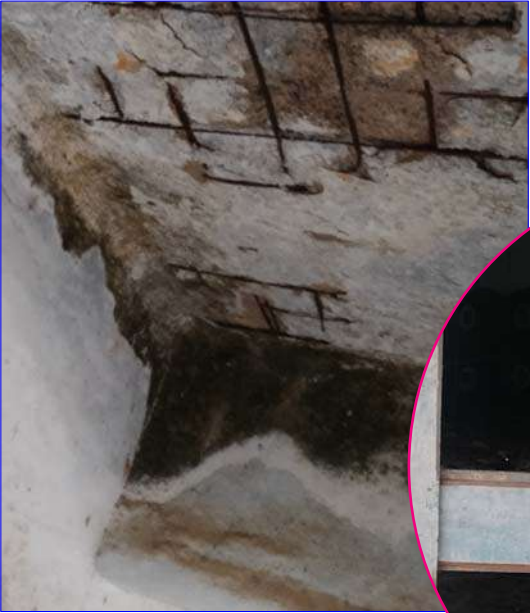
మహాబాబాబాద్ /గార్ల /జూన్ 4/అక్షరం న్యూస్...

మహాబాబాబాద్ జిల్లా, గార్ల మండల పరిధిలోని చిన్నకొత్తపూరం మండల పరిషత్ ప్రాథమిక పాఠశాల భవనం శిథిలావస్థకు చేరడంతో విద్యార్థులు నానా అవస్థలు పడుతున్నారు. వర్షాకాలంలో ఈ భవనం కూలిపోయే ప్రమాదం ఉంది. వెంటనే పాఠశాల భవనంపై అధికారులు ద్రుష్టి సారించి శిథిలావస్థలో ఉన్న పాఠశాల భవనాన్ని కూల్చివేసి, నూతన భవన నిర్మాణం చేపట్టాలని స్థానిక ప్రజలు కోరుతున్నారు. పాఠశాల భవనం అత్యంత దారుణంగా ఉంది. శిథిలావస్థలో ఉన్న పాఠశాల భవనం ఎప్పుడు కూలిపోతుందో తెలియని పరిస్థితి ఏర్పడింది. పెద్ద ప్రమాదాలు జరిగే అవకాశాలు ఉన్నాయి. ప్రమాదాలు జరిగిన తరువాత జాగ్రత్తలు తీసుకునే కన్నా, ప్రమాదాలు జరగకుండా ప్రత్యామ్నాయ ఏర్పాటు చేయాలని విద్యార్థుల తల్లిదండ్రులు, స్థానికులు విన్నవించుకుంటున్నారు. గోడల పై కప్పు యొక్క పై పొరలు పడిపోయి విద్యార్థులకు ప్రమాదం పొంచి