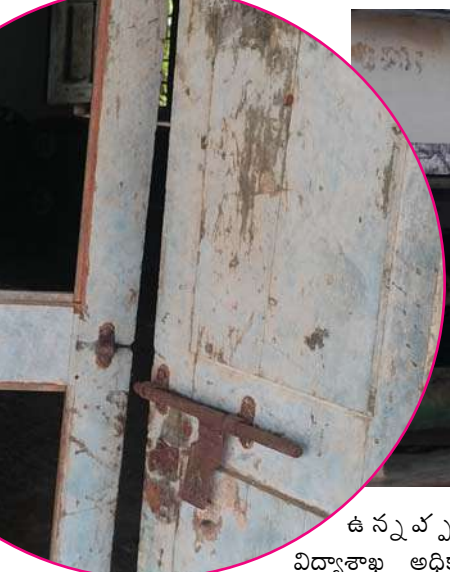
ఉన్నప్పటికీ విద్యార్థులు అధికారులు పట్టించుకోక పోవడం పై ప్రజలు

అగ్రహిస్తున్నారు. పాఠశాల విద్యార్థుల ప్రాణాలతో ప్రభుత్వం చెలాటం అవుతుంది. శిథిలావస్థలో ఉన్న పాఠశాలలో ప్రమాదం జరిగితే బాధ్యులు ఎవరు అని స్థానిక ప్రజలు కోరుతున్నారు. 1991 వ సంవత్సరంలో నిర్మించిన పాఠశాల భవనం కూలిపోయి, ప్రమాదం వాటిల్లే అవకాశం ఉన్నప్పటికీ విద్యార్థులు ఉన్నత అధికారులు పట్టించుకోకపోవడంతో స్థానిక ప్రజలు అసహనం వ్యక్తం చేస్తున్నారు. పాఠశాలకు పిల్లలను పంపాలంటే భయం వేస్తుందని, ఏ సమయం లో ప్రమాదం జరుగుతుందోనని అరచేతిలో ప్రాణాలు పెట్టుకొని పిల్లలను బడికి పంపుతున్నామని పిల్లల తల్లిదండ్రులు ఆందోళన చెందుతున్నారు. ఈ విద్య సంవత్సరం పాఠశాల ప్రారంభం లోనే శిథిలావస్థలో ఉన్న పాఠశాల భవనాన్ని కూల్చివేసి, ప్రమాదం నుండి విద్యార్థులను కాపాడాలని, విద్యార్థులకు నాణ్యమైన విద్యను అందించే విధంగా అధికారులు కృషి చేయాలని ప్రజలు కోరుతున్నారు.