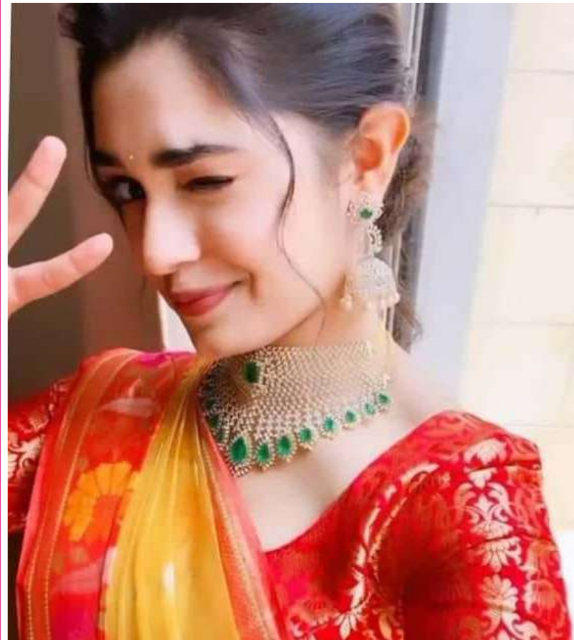
హైదరాబాద్, జూన్ 4 అక్షరం న్యూస్)