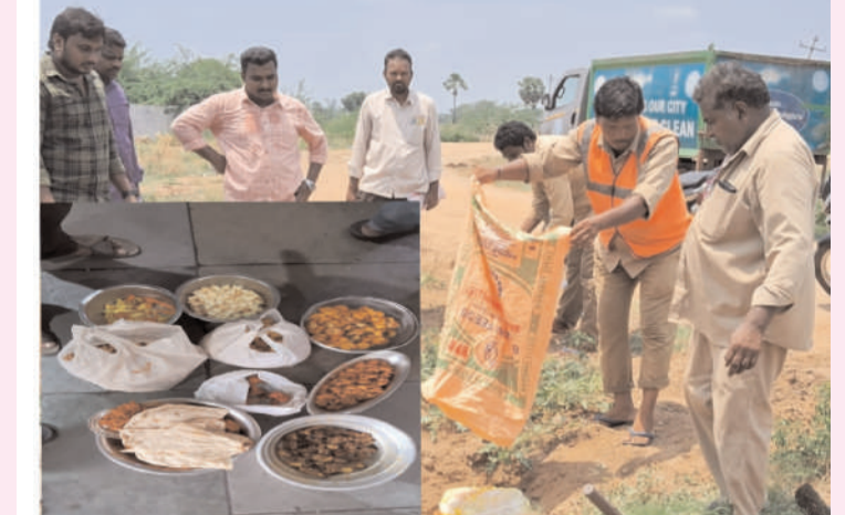
పెద్దపల్లి టౌన్ జూన్ 07 అక్షరం న్యూస్