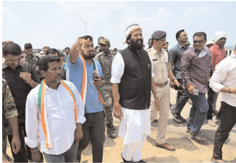
పెద్దపల్లి, ప్రతినిధి జూన్ -07 అక్షరం న్యూస్

సుందిళ్ళ బ్యారేజ్ పునరుద్ధరణ పనులు యుద్ధ ప్రాతిపదికన పూర్తి చేయాలని రాష్ట్ర నీటి పారుదల, పౌర సరఫరాల శాఖ మంత్రి ఉత్తమ్ కుమార్ రెడ్డి సంబంధిత ఇంజనీరింగ్ అధికారులను, గుత్తేదారు ఏజెన్సీలను ఆదేశించారు. కాళేశ్వరం ప్రాజెక్టులో నిర్మించిన మూడు బ్యారేజ్ ల సందర్భంలో భాగంగా శుక్రవారం రాష్ట్ర నీటి పారుదల, పౌర సరఫరాల శాఖ మంత్రి ఉత్తమ్ కుమార్ రెడ్డి మంథని మండలం సరిపురం గ్రామం వద్ద నిర్మించిన సుందిళ్ళ (పార్వతి) బ్యారేజ్ ను సందర్శించారు. సుందిళ్ళ (పార్వతి) బ్యారేజ్ ను ఆసాంతం మంత్రి పరిశీలించారు. జాతీయ డ్యూమ్ సెస్టీ అథారిటీ అందించిన సూచనల ప్రకారం మరమ్మత్తు, పునరుద్ధరణ పనులు వేగవంతంగా పూర్తి కావాలని, క్షేత్రస్థాయిలో పనుల పురోగతిలో ఆశించిన మేర ఫలితం కనపడటం లేదని, అవసరమైన మేర అదనపు బ్యూండాలును ఏర్పాటు చేసి పనులు వేగవంతం చేయాలని మంత్రి అధికారులను, గుత్తేదారులను ఆదేశించారు. బ్యారేజ్ పునరుద్ధరణ పనులు యుద్ధ ప్రాతిపదికన నిర్వహించాలని, ప్రతి పనికి సంబంధించి నిర్దేశిత సమయాన్ని నిర్దేశించుకొని దానిలోపు ఆ పని పూర్తి చేసే విధంగా ఏజెన్సీలు పనిచేయాలని, ఏ పని ఎప్పుడీ వరకు పూర్తవుతుందో కాగితంపై పెద్దపల్లి రూపొందించి అందించాలని మంత్రి ఆదేశించారు. సుందిళ్ళ (పార్వతి) బ్యారేజ్ సమీపంలో గల పంచ్ మోన్ సంరక్షణ కోసం నిర్మిస్తున్న కట్ట వల్ల స్థానికలకు కలిగే సమస్యలను స్థానిక మంత్రివర్గులు తో కలిసి అంచనా వేసి వాటి పరిష్కార మార్గాలను సూచిస్తూ ప్రతిపాదనలు సమర్పించాలని మంత్రి సంబంధిత ఇంజనీరింగ్ అధికారిని ఆదేశించారు.