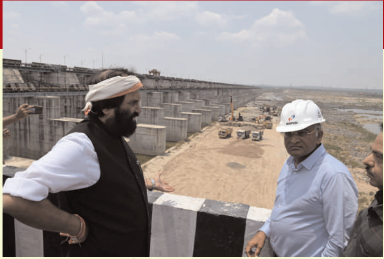
కరీంనగర్, జూన్ 7 (అక్షరం న్యూస్):

కాశీశ్వరం ప్రాజెక్టు దెబ్బ తిన్న చోట్ల మరమ్మత్తు పనులను వేగవంతం చేయాలని నిర్మాణ సంస్థలను మంత్రి ఉత్తర్వుకుమార్చే ఆదేశించారు. ఎన్నికల కోడ్ ముగియడంతో అన్నారం, మేడిగడ్డ, సుందిళ్ల బ్యారేజీల పరిశీలనకు మంత్రి ఉత్తర్వు వెళ్లారు. ఈ సందర్భంగా మంత్రి మాట్లాడుతూ ఎన్నికల కోడ్ వల్ల కాశీశ్వరంపై రివ్యూ జరగలేదు. భారాన హయాంలోనే మేడిగడ్డ కుంగింది. రూ.94 వేల కోట్లు అప్పు చేసి కట్టిన ప్రాజెక్టు కుంగిపోతే ప్రస్తుత కాంగ్రెస్ ప్రభుత్వం దానికి వడ్డీ కట్టాల్సి వస్తోంది. కాంగ్రెస్ అధికారంలోకి రాగానే నేషనల్ డ్యామ్ సెప్టి అథారిటీని సంప్రదించి పరిశీలన చేయమని కోరాం. నిపుణుల కమిటీ కొన్ని సూచనలు చేసింది. మేడిగడ్డ కుంగిన వెంటనే గేట్లు ఎత్తి ఉంటే ఇంత డ్యామేజీ జరగదే కాదని తెల్పింది. దెబ్బతిన్న చోట్ల కొన్ని రిపేర్లు చేసి