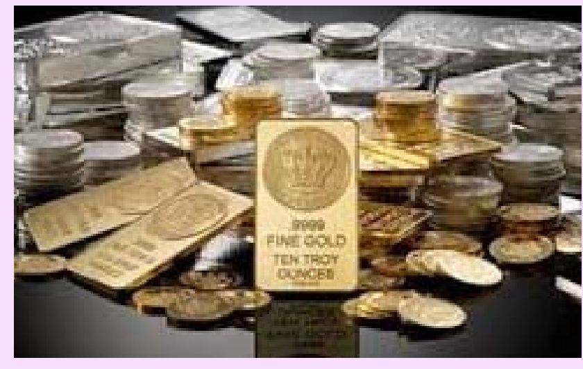
హైదరాబాద్, జూన్ 7 (అక్షరం న్యూస్)

యూఎస్ లో జాబ్ డేటా తర్వాత పేరోల్ డేటా ఫోకస్ లోకి రావడంతో అంతర్జాతీయ మార్కెట్ లో పసిడి పరుగు కొనసాగుతోంది. ప్రస్తుతం, ఔస్ట్ బంగారం ధర 2,391 డాలర్ల వద్ద ఉంది. మన దేశంలోనూ క్షణం లేని గుర్రంలా బంగారం పరుగులు పెడుతోంది. ఈ రోజు 10 గ్రాముల ఆర్కెమెంట్ బంగారం (24 కేరెట్లు) ధర 770 రూపాయలు, స్వప్నపైన పసిడి (22 కేరెట్లు) ధర 700 రూపాయలు, 18 కేరెట్ల గోల్డ్ రేటు 570 రూపాయల చొప్పున పెరిగాయి. కిలో వెండి రేటు కేవలం 100 తగ్గింది. తెలుగు రాష్ట్రాల్లో బంగారం, వెండి రేట్లు ఇలావున్నాయి. హైదరాబాద్ మార్కెట్ లో 10 గ్రాముల 24 క్యారెట్ల బంగారం ధర 73,420 వద్దకు; 22 క్యారెట్ల బంగారం ధర 67,300 వద్దకు; 18 క్యారెట్ల బంగారం ధర 55,060 వద్దకు చేరింది. కిలో వెండి ధర హైదరాబాద్ మార్కెట్ లో 96,100 గా ఉంది. ఏపీ, తెలంగాణవ్యాప్తంగా ఇదే ధర అమల్లో ఉంది. విజయవాడలో 10 గ్రాముల 24 క్యారెట్ల బంగారం ధర 73,420 వద్దకు; 22 క్యారెట్ల ఆర్కెమెంట్ బంగారం ధర 67,300 వద్దకు; 18 క్యారెట్ల బంగారం ధర 55,060 వద్దకు చేరింది. ఇక్కడ కిలో వెండి ధర 96,100 గా ఉంది. విశాఖపట్నం మార్కెట్ లో బంగారం, వెండికి విజయవాడ రేట్ అమలవుతోంది.