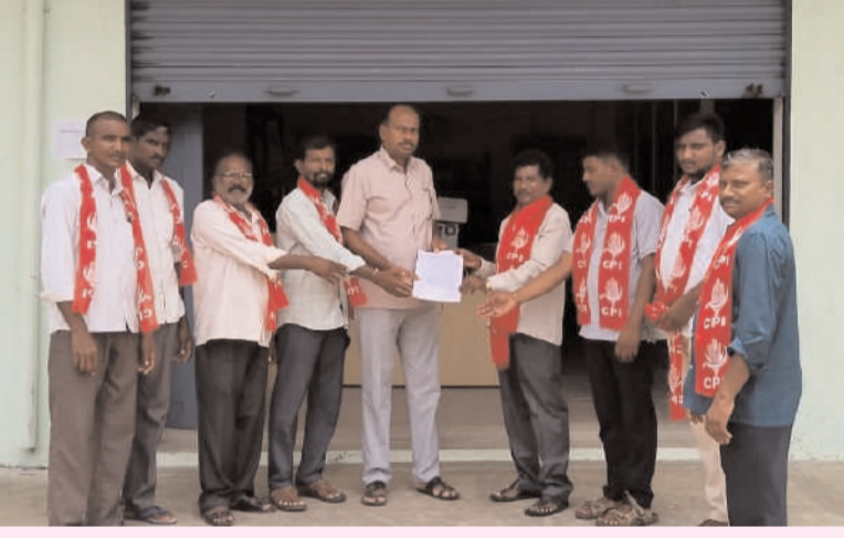
మహబూబాబాద్ / గార్ల / జూన్ 7/అక్షరం న్యూస్...

సకీలి విత్తనాల విషయంలో రైతులను అప్రమత్తం చేయాలి ఎమ్మార్సీ కి మించి విత్తనాలు అమ్మితే చర్యలు తీసుకోవాలి సిపిఐ పార్టీ అధ్యక్షులలో వినతి పత్రం అందజేత