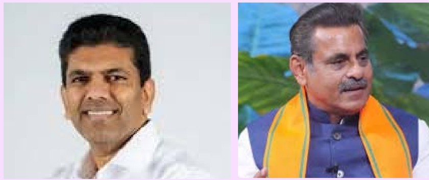
హైదరాబాద్, జూన్ 7 (అక్షరం న్యూస్)