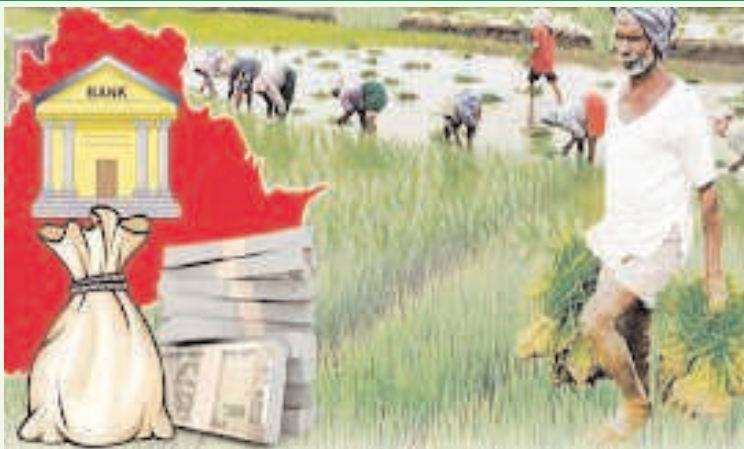
న్యూఢిల్లీ,జూన్ 28(అక్షరం న్యూస్): తెలంగాణ సార్వత్రిక ఎన్నికల్లో ఇచ్చిన హామీ ప్రకారం రైతు రుణమాఫీకి రేవంత్ ప్రభుత్వం శ్రీకారం చుట్టింది. ఆగస్టు-15 లోగా ఈ హామీని నెరవేరుస్తానని పార్లమెంట్ ఎన్నికల సందర్భంగా మాట్లాడిన సంగతి తెలిసిందే. ఇందుకు సంబంధించి పత్రికా దాదాపు మొదలైంది. ఢిల్లీ పర్యటనలో బిజిబిజీగా ఉన్న సిఎం రేవంత్ రెడ్డి మిడియా సమావేశం నిర్వహించారు. ఈ సందర్భంగా రుణమాఫీ