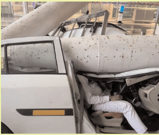
న్యూఢిల్లీ,జూన్ 28(అక్షరం న్యూస్): ఢిల్లీలో కురుస్తున్న భారీ వర్షాల నేపథ్యంలో ఇందిరాగాంధీ విమానాశ్రయం లోని టెర్రిస్ట్ 1లో కొంత పైకప్పు భాగం కూర్చుకుంది. ప్రమాదంలో ఒకరు మృతి చెందగా.. 8 మంది గాయపడ్డారు. వెంటనే సహాయక చర్యలు కొనసాగుతున్నాయి. ప్రమాదంలో పైకప్పు కింది పార్ట్ చేసిన అనేక వాహనాలు కూడా ధ్వంసమయ్యాయి. పైకప్పు కూలడంతో కారులోని వ్యక్తి మృతి చెందినట్లు అధికారులు తెలిపారు. ఈ ప్రమాదం కారణంగా

పలు ప్రాంతాలన్నీ జలమయం విమానాశ్రయంలో కూలిన టెర్రిస్ట్ కప్పు కారులోనే ఉన్న వ్యక్తి అక్కడికక్కడే మృతి పలు కార్లు ధ్వంసం...సమాయక చర్యలు ముమ్మరం గటనా స్థలిని పరిశీలించిన మంత్రి రామ్మోహన్ నాయుడు