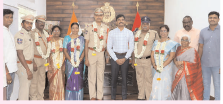
భద్రాద్రి జిల్లా/ కొత్తగూడెం /మే.31/అక్షరం న్యూస్