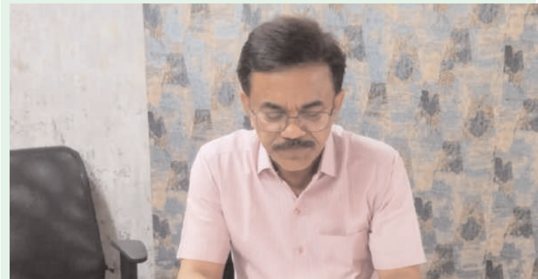
ఖమ్మం /తల్లాడ మే 31 (అక్షరంస్వ్యాస్)