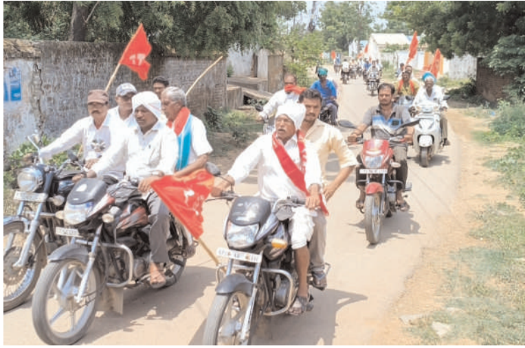
మహబూబాబాద్ /గృహ /మే 31/అక్షరం న్యూస్...