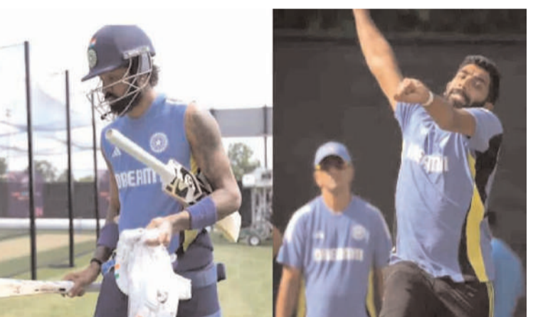
ఐసీసీ ట్రోఫీ వేటకు సిద్ధమైన టీమిండియా ప్రాక్టీస్ వేగం పెంచింది. టీ20 వరల్డ్ కప్ సన్నాహకాల్లో భాగంగా.. న్యూయార్క్ లోని కంటిగూ సార్స్ లో భారత జట్టు నెట్ సెషన్ లో పాల్గొంది. కెప్టెన్ రోహిత్ శర్మ తో పాటు భారత క్రికెటర్లు నెట్ లో తీవ్రంగా శ్రమించారు.

వైస్ కెప్టెన్ హార్దిక్ పాండ్యా డ్రెస్ షాట్లు సాధన చేయడం పూర్తయ్యాక బౌలింగ్ వేశాడు. కుర్ర ఓపెనర్ యశస్వి జైస్వల్, రిషభ్ పంత్, హిట్టర్ శివం దూబే, రింకా సింగ్, రవీంద్ర జడేజాలు తమ బ్యాట్ వపర చూపించారు.