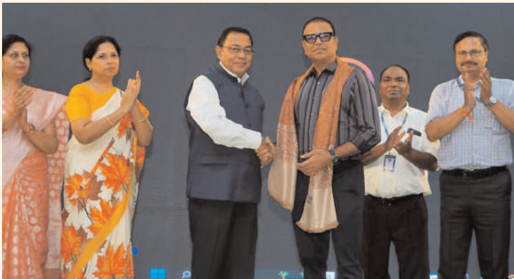
జోలెపల్లి నగర్ మే 31 పెద్దపల్లి జిల్లా అక్షరం స్వ్యాస్