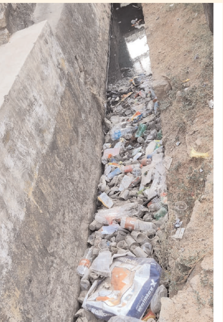
రాజన్న సిరిసిల్ల/గంభీరాపుపేట/మే31(అక్షరం స్వూస్)

గంభీరాపుపేట మండలం పేరుకు మాత్రమే మండల కేంద్రం గ్రామ పంచాయతీ సర్పంచుల పదవి కాలం పూర్తవగానే రాష్ట్ర ప్రభుత్వం ప్రత్యేక అధికారులను గ్రామ పంచాయతీలకు కేటాయించింది కానీ ఇప్పుడు గ్రామపంచాయతీ ప్రత్యేక అధికారుల పనితీరు ప్రజలకు శాపంగా మారింది జీతాలు రాక సఫాయి కార్మికుల సమస్యలతో చెత్త కుప్పలు పెరుగుతోంది మురికి కాలువలు చెత్తచెదారం నిండాలు మండల కేంద్రంలో ముక్కు మూసుకుని నడిచే దుస్థితి నెలకొంది ఉదయం ప్రజలు నిద్ర లేవక ముందే రోడ్లన్నీ పరిశుభంగా ఉంచే సఫాయి కార్మికులు సమస్యల పట్లదంతో రోడ్ల మరయు డ్రైనేజీలు మొత్తం చెత్తతో నిండిపోయాయి ప్రధాన రహదారి గుండా నడవాలి అంటే ముక్కు మూసుకుని వెళ్లే దుస్థితి దాపుందింది గ్రామపంచాయతీ అధికారులు మాత్రం ప్రజల సమస్యలను పట్టించుకోవడంలేదని ప్రజలు ఆవేదన వ్యక్తం చేస్తున్నారు ఇప్పటికైనా గ్రామపంచాయతీ అధికారులు పట్టించుకుని మురికి కాలువలను మరయు రోడ్లపై ఉన్న చెత్తచెదారాల లేకుండా చూడాలని అధికారులను ప్రజలు కోరుతున్నారు