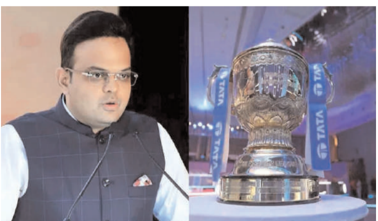
మెగా ఆక్షన్ బాధ్యతను ఆమెకే అప్పగిస్తారా? లేదా అనేది తెలియాల్సి ఉంది. పదిహేడో సీజన్ లో కోల్ కతా నైట్ రైడర్స్ చాంపియన్ గా నిలిచింది. ఏకపక్షంగా సాగిన టైటిల్ పోరులో సర్వైవిభ్య హైదరాబాద్ ను చిత్తు చేసి మూడో టైటిల్ సొంతం చేసుకుంది.