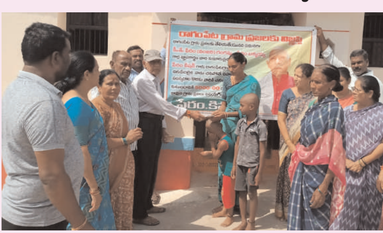
చొప్పండీ /కరీంనగర్, మే 31(అక్షరం స్వ్యాస్ )