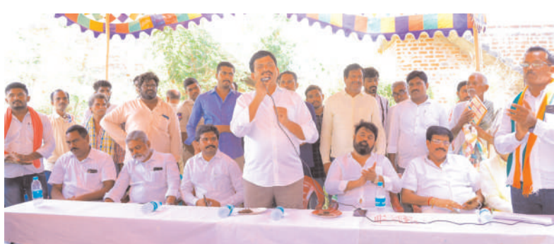
ఖమ్మం/తల్లాడ మే 31 (అక్షరంస్వూస్)

పాలేరు నా సొంతిల్లు.... చక్కబెట్టుకునే బాధ్యత నాది.. మూడేళ్లలోపే అర్బులైన ప్రతీ ఒక్కరికీ ఇందిరమ్మ ఇళ్లు.. ఏడాదిలోపు రోడ్లు, డ్రైనేజీలు పూర్తిచేయిస్తా.. తాగునీరు, సాగునీరుకి ఇబ్బందులు రానివ్వను.. తిరుమలాయపాలెం మండల పర్వటనలో మంత్రి పొంగులేటి శ్రీనివాస రెడ్డి