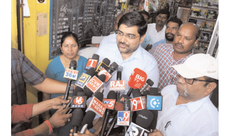
యూదాధి ఘోషనగరి,మే 31 (అక్షరం స్పూస్)