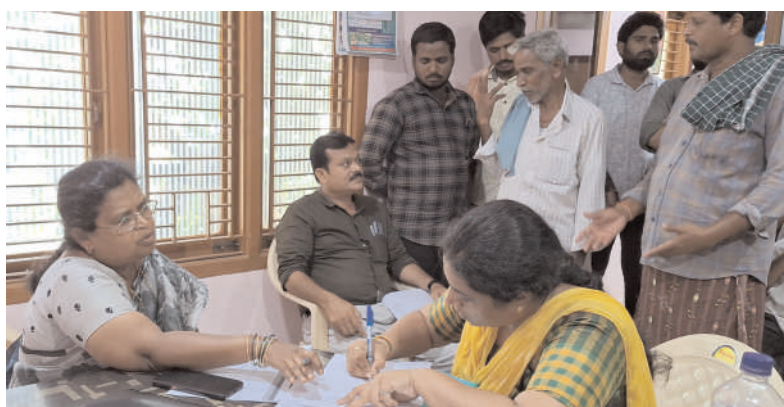
ఖమ్మం/ తల్లాడ మే 31 (అక్షరం న్యూస్)