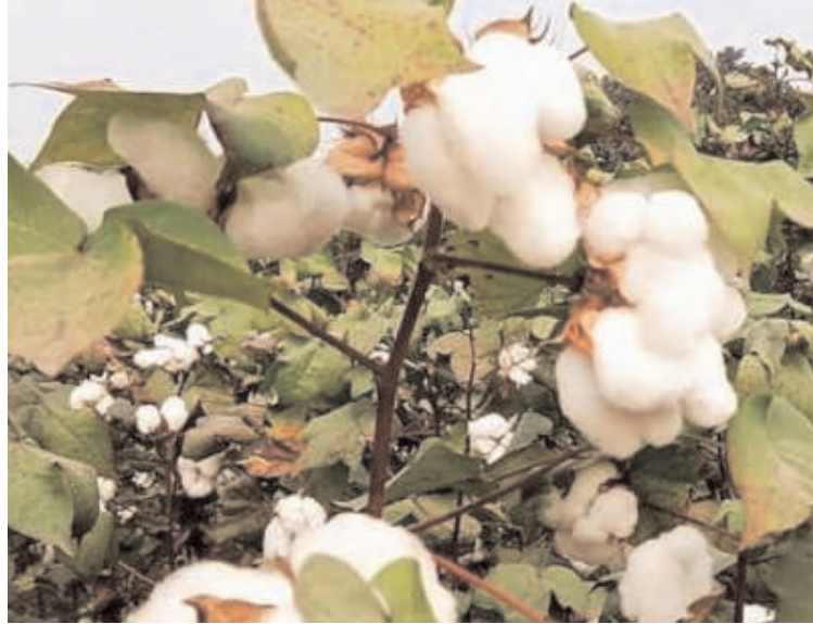
75 లక్షలు ప్యాకెట్లు అందుబాటులో ఉంచామని తెలిపారు. మిగతావి కూడా జూన్ 5 లోపు సరఫరా చేయాల్సిందిగా ప్రతి కంపెనీలకు ఆదేశాలు ఇచ్చామని తెలిపారు.

గత సంవత్సరం కంటే దాదాపు 30 వేల క్వింటాలు అధికంగా పంపిణీ చేశామన్నారు. పత్తి ప్యాకెట్లు గత సంవత్సరం మే చివరి తేదీ నాటికి 45 లక్షలు అందుబాటులో ఉండగా ఈ సంవత్సరం ఇప్పటికీ