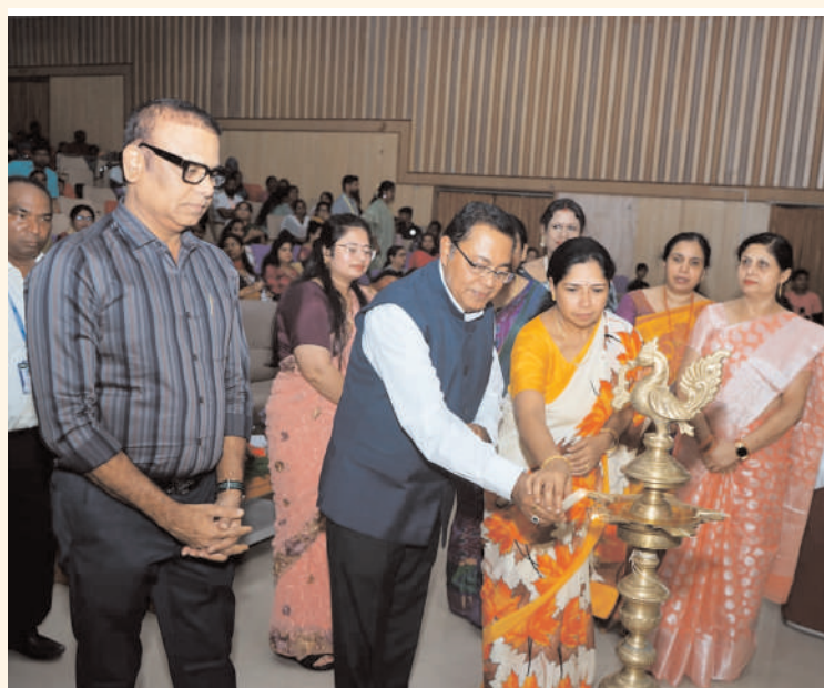
జోలెపల్లి నగర్ మే 31 పెద్దపల్లి జిల్లా అక్షరం స్వ్యాస్