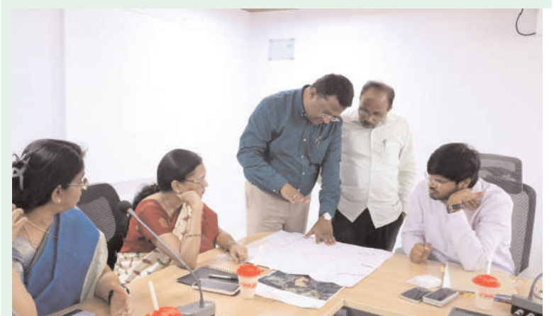
జిల్లా కలెక్టర్ వి.పి. గౌతమ్