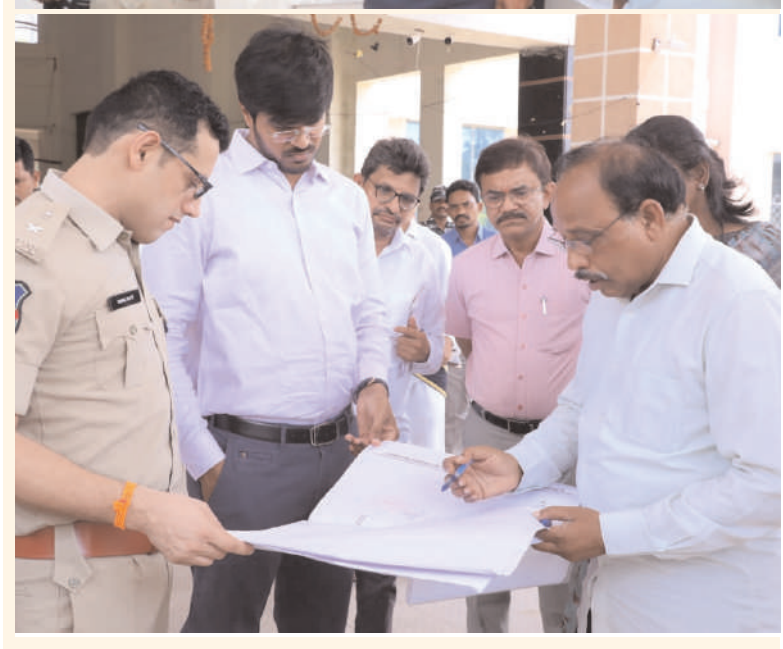
ఖమ్మం / తల్లాడ మే 31 (అక్షరం న్యూస్)