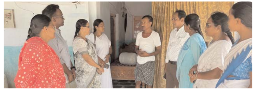
(మొదటి పేజీ తరువాయి) అనంతరం ఇటీవల కాలంలో ధరావత్ తండాలో ఐదు డెంగ్యూ పాజిటివ్ కేసులు నమోదు అవడం జరిగిందని దీని కొరకు పాజిటివ్ లు వచ్చిన ఇళ్లను మరియు పరిసరాల్లోని 62 గృహములకు పైరిత్రం (స్ప్రే) చేయించారు. తండాలోని ప్రతి గృహమును సందర్శించి తండా వాసులకు డెంగ్యూ వ్యాధి నివారణ చర్యలపై సూచనలు, సలహాలు ఇచ్చారు.