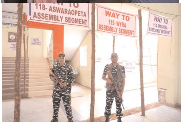
(మొదటి పేజీ తరువాయి) సిసి కెమెరాలు అంతరాయం లేకుండా పనిచేయుటకు చర్యలు చేపట్టినట్లు ఆయన అన్నారు. అభ్యర్థులు, అభ్యర్థుల ఏజెంట్లు వచ్చి