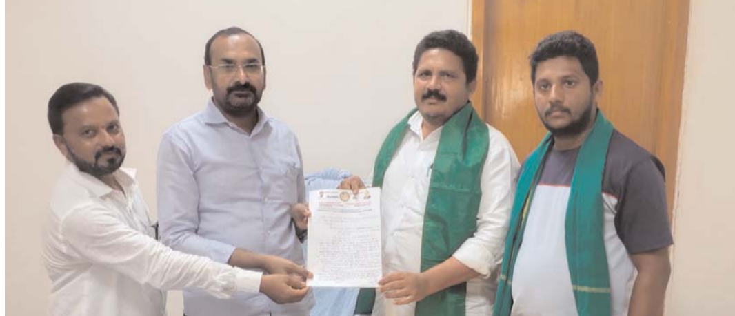
తొలగించడం జరిగిందని అన్నారు. ఉద్యోగులు ఎవరైనా చిన్న చిన్న తప్పలు చేసి ఉంటే మేమె రూపంలో కానీ నోటీసు రూపంలో గానీ మందలించడం కాకుండా ఎటువంటి నోటీసులు లేకుండా గిరిజన ఉద్యోగులు అంటేనే విధుల నుండి తొలగించే కార్యక్రమాన్ని చేపట్టారని అన్నారు. గత సంవత్సరంలో ఇదే ఎంబాడి హక్కుల పోరాట సమితి అధ్యక్షులలో ప్రైవేట్ పాఠశాలలో ఫీజుల నియంత్రణ విషయంలో కానీ పర్యవేక్ష లేని పాఠశాలల విషయంలో కానీ పర్యవేక్ష లేని వాహనాల విషయంలో కానీ చాలాసార్లు విన్నవించిన చర్యలు తీసుకోకుండా కేవలం ప్రైవేటు పాఠశాలల యాజమాన్యం అనుకూలంగా వ్యవహరించారు. మహబూబాబాద్ గిరిజన జిల్లాలో విద్యార్థివృద్ధి జరగకుండా అవివేది అక్రమాలకు పాల్పడుతున్నారన్నారు. టిఈడి పట్ల లేని డిఈవో ప్రధానోపాధ్యాయులను, ఉపాధ్యాయులను, పిల్లలను ఏ