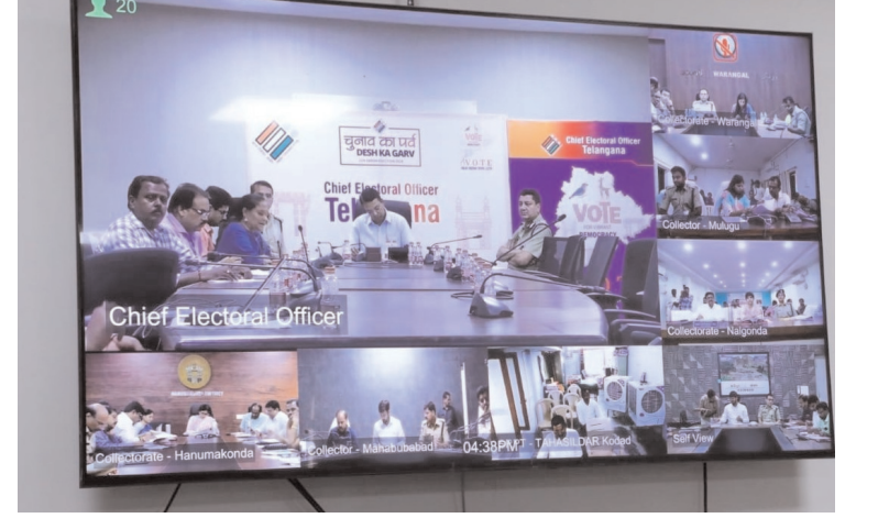
కేసరి ఖమ్మం మే 22 (అక్షరం న్యూస్)