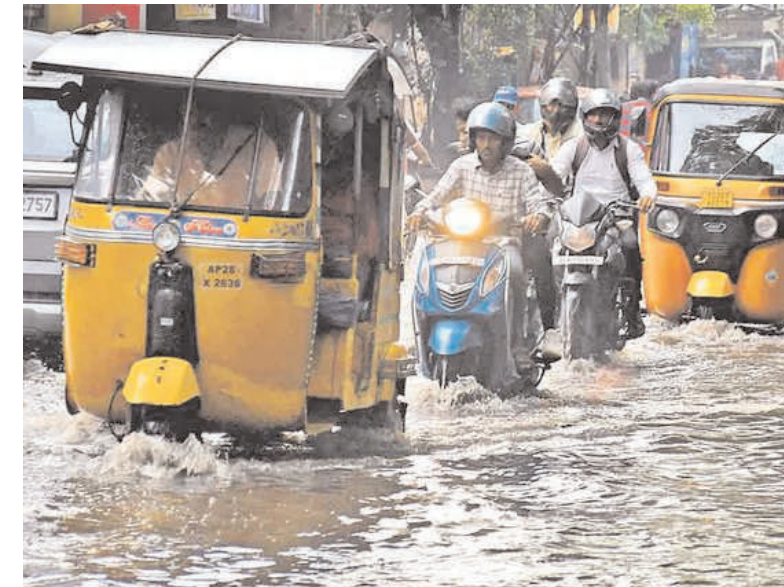
హయత్ నగర్, సంతోష్ నగర్, చార్మినార్, ఫలక్ నుమా, రాజేంద్రనగర్, గుడి మల్కాపూర్, పేకపేట, అనెట్లీ, కేబీఆర్ పార్కు, ఎన్టీఆర్ స్టేడియం, శిల్పారామం, గచ్చిబౌలి, మల్కాజిగిరి, మెట్టూర్ గూడ తదితర చెట్లు విరిగిపడ్డాయి. డీఆర్ఎఫ్ బృందాలు చేరుకుని విరిగి పడిన కొమ్మలను, నెలకొరిగిన చెట్లను తొలగించారు. ఈ సందర్భంగా ఈ ప్రాంతాల్లో విద్యుత్ అంతరాయం ఏర్పడింది.

వరుణుడి ప్రతాపం.. నగరం ఆగమాగం ఉప్పొగిన నాలాలు.. మ్యూన్ హెళ్లు ఉదయనగర్ లో ధ్వంసమైన నాలా పైకప్పు వరద తాకిడికి కొట్టుకుపోయిన బైకులు చెరువులను తలపించిన రహదారులు విరిగిపడిన చెట్లు..విద్యుత్ సరఫరాకు అంతరాయం గంటల తరబడి ట్రాఫిక్ జామ్.. ప్రయాణికులకు నరకయాతన జీహెచ్ఎంసీకి ఫిర్యాదుల వెల్లువ మరో రెండ్రోజులు వర్షాలుంటాయన్న వాతావరణ శాఖ