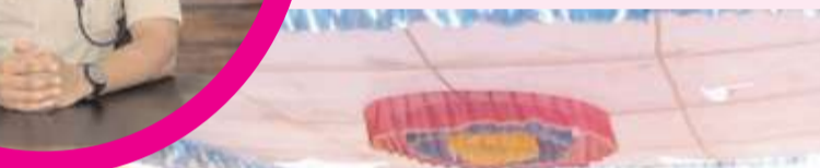
పోలింగ్ కేంద్రాల్లో కాగునీరు, నీడ, ఫ్యాన్లు తదితర సౌకర్యాలు అన్ని కల్పించామని తెలిపారు. జిల్లాలో నేడు ఉదయం 7 గంటల నుండి 4 గంటల వరకు పోలింగ్