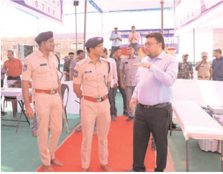
-జిల్లా ఎన్నికల అధికారి, జిల్లా కలెక్టర్ బదాపల్ సంతోష్