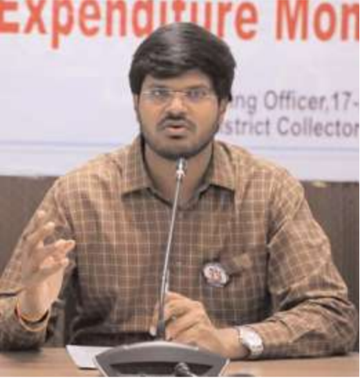
నారాయణపురం వద్ద ఇందియన్ నేషనల్ కాంగ్రెస్ పార్టీకి చెందిన