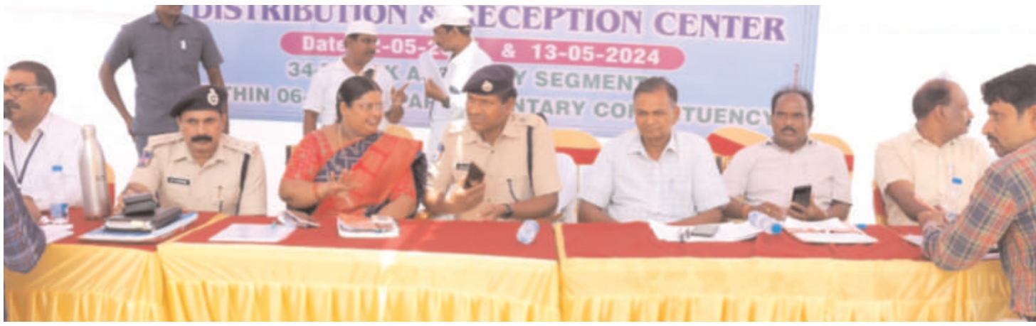
-స్వేచ్ఛాయుతవాతావరణంలో తమ ఓటు హక్కు వినియోగించుకోవాలి జిల్లా ఎస్సీ బాలస్వామి.