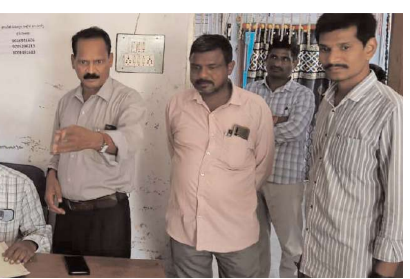
వైరా ముస్లింపాలిటీలో త్రాగునీటి హెల్ప్ లైన్ కౌంటర్ల ఏర్పాటు త్రాగునీరు అందించేందుకు కృషి చేయటమే వైరా ముస్లింపాలిటీ చేయడం జరిగిందని ప్రజలకు ఎలాంటి ఇబ్బంది కలగకుండా డ్యూయం అని కమిషనర్ సిహెచ్ వేణు తెలిపారు.

ఖమ్మం/ వైరా ఏప్రిల్ 8 (అక్షరం న్యూస్): వైరా ముస్లింపాలిటీలో వేసవికాలం సేవధ్యంలో త్రాగునీటి సమస్యను అరికట్టేందుకు ముస్లింపాలిటీలో ప్రత్యేక హెల్ప్ లైన్ ను ఏర్పాటు చేయడం జరిగిందని ముస్లింపాలిటీ కమిషనర్ వేణు తెలిపారు? సోమవారం ముస్లింపాలిటీలో ప్రత్యేక త్రాగునీటి హెల్ప్ లైన్ కౌంటర్ ను ఆయన ప్రారంభించారు హెల్ప్ లైన్ నెంబర్ 9666926606, 9705280213, 8008491683 నెంబర్ లకు ఫోన్ చేయాలి అన్నారు ? ఈ సందర్భంగా కమిషనర్ వేణు మాట్లాడుతూ ముస్లింపాలిటీలో ఏ ప్రాంతంలో అయినా త్రాగునీటి సమస్య ఏర్పడి ఉంటే ప్రజలు తక్షణమే త్రాగునీటి హెల్ప్ లైన్ నెంబర్లకు ఫోన్ చేసి సమస్యను వివరించాలని తెలిపారు, అదే విధంగా నిత్యం ముస్లింపాలిటీలో త్రాగునీటి సమస్య పరిష్కారం చేయడం ఎలాంటి ఎద్దడి రాకుండా ఉండేవిధంగా ఇద్దరు ప్రత్యేకంగా నియమించడం జరిగింది ఆ ఇద్దరు వ్యక్తులు నిత్యం వార్డులలో పర్యటిస్తూ ఉంటామని ప్రజలు నీటి సమస్యను త్రాగునీటి ఇబ్బంది కలిగిన ప్రాంతాన్ని వెంటనే ముస్లింపాలిటీ దృష్టికి తీసుకురావాలని ఆయన తెలిపారు, జిల్లా కలెక్టర్ ఆదేశాల మేరకు ముందస్తుగా