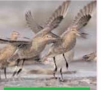
మిగతా 2వ పేజీలో..