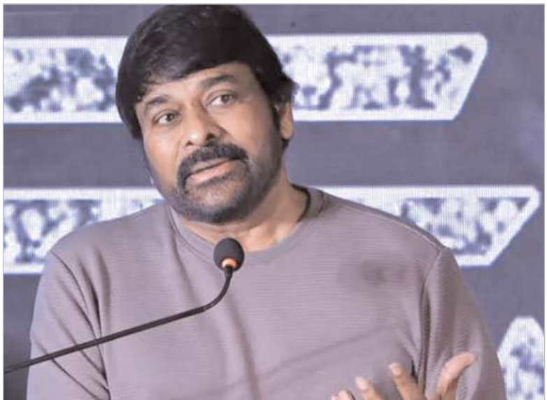
అన్నలాంటి వ్యక్తి. అమ్మకు ఒక పెద్ద కొడుకు ఉంటే ఏం చేస్తారో మాత్రమే ఉంటాయని అన్నారు.