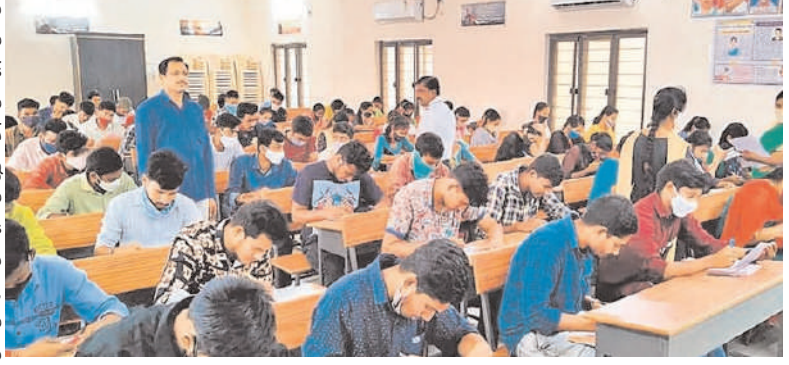
నిరుద్యోగులకు మేలు జరుగుతుందని విద్యార్థి సంఘాలు కోరుతున్నాయి.