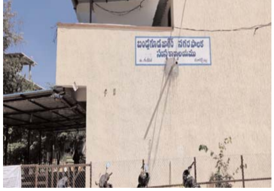
స్పందించిన దివ్య విచారణ జరపాలని జలోపల్లి కమిషనర్ ఉమను ఆదేశించారు. ఈ మేరకు మంగళవారం కార్పొరేషన్ కార్యాలయంలో మధ్యాహ్నం 12 గంటల నుంచి విచారణను ప్రారంభించారు. సాయంత్రం 7 గంటల వరకు ఈ విచారణ జరిపారు. ఈ సందర్భంగా

- పది నెలలుగా శారీరకంగా, మానసికంగా బాధిస్తున్నట్లు సీడీఎంఐలో ఫిర్యాదు - వెంటనే విచారణకు ఆదేశించిన ఐపిఎస్ అధికారి శివ్కుమార్ - మధ్యాహ్నం 12 గంటల నుంచి సాయంత్రం 7 గంటల వరకు విచారణ రంగారెడ్డి / రాజేంద్రనగర్ / గండిపేట్ / ఏప్రిల్ 23/ అక్షరం: న్యూస్ : బండ్లగూడ జాగిర్ మున్సిపల్ కార్పొరేషన్ కార్యాలయంలో కీచక చర్యం చోటచేసుకుంది. మహిళా ఉద్యోగులను మానసికంగా, శారీరకంగా వేధిస్తున్న పురుష ఉద్యోగిపై మహిళా ఉద్యోగిని ఫిర్యాదు చేసింది. వేధింపులు తప్పుకోలేక సీడీఎంఐ అధికారికి దివ్యకు ఫిర్యాదు చేయడంతో విచారణ జరపాలని జలోపల్లి కమిషనర్ ఉమను ఆదేశించారు. వివరాల ప్రకారం బండ్లగూడ జాగిర్ మున్సిపల్ కార్పొరేషన్ కార్యాలయంలో ఓ ఉన్నతాధికారి మహిళా ఉద్యోగిని గత పది నెలలుగా వేధింపులకు గురి చేస్తున్నాడు. మానసికంగా, శారీరకంగా వేధింపులకు గురి చేస్తుండటంతో విసిగిపోయిన మహిళా ఉద్యోగిని సీడీఎంఐ అధికారికి దివ్యకు ఫిర్యాదు చేసింది. ఈ మేరకు