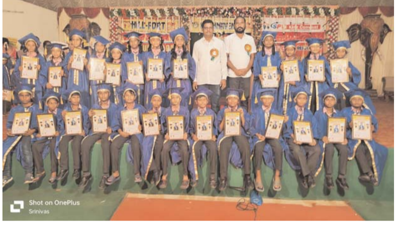
రామగిరి (పెద్దపల్లి జిల్లా) ఏప్రిల్ 23 అక్షరం స్వాగతం: రామగిరి మండలం కల్వపల్లి లోని స్నానిక కృష్ణవేణి టాలీబ్ స్కూల్ లో మంగళవారం స్నాతకోత్సవ వేడుకలు, స్పృష్ట దే, మరయి రిజిస్ట్రే డే వేడుకలను ఘనంగా నిర్వహించారు. యాకేజీ, నివ తరగతి విద్యార్థులకు