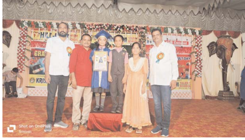
స్నాతకోత్సవం చేశారు.జనవరిలో రివజిక్ డే సందర్భంగా నిర్వహించిన అటల పోటీలో విజేతలకు బహుమతి ప్రధానం చేయడం జరిగింది. అదే విధంగా వార్షిక పరీక్షల ఫలితాలలో తరగతి వారీగా మొదటి, రెండవ ర్యాంకులు సాధించిన విద్యార్థులకు బహుమతి ప్రధానం