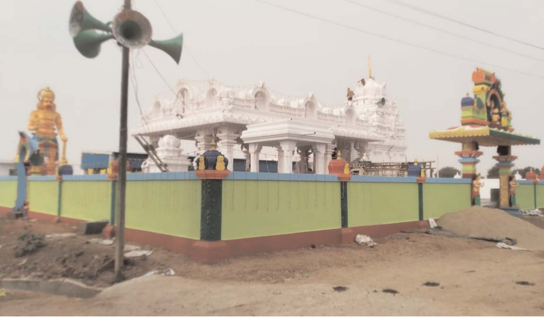
సీతారామాంజనేయ దేవాలయ నూతన దేవస్థాన నిర్మాణ కమిటీ సభ్యులు పత్రికా సమావేశంలో తెలిపారు.

సూర్యాపేట/నేరేడుచర్ల ఏప్రిల్ 23 (అక్షరం స్పూన్): నేరేడుచర్ల మండల పరిధిలోని వైకుంఠాపురం గ్రామంలో శ్రీ సీతారామాంజనేయ స్వామి నూతన దేవాలయ పరివార సాహిత శీలక (బోడ్రాయి) ముత్యాలమ్మ దుర్గ కాంచనమ్మ కోట మైసమ్మ పోతురాజు శిఖర మరియు జీవద్వజ గణపతి సుబ్రహ్మణ్య ఆదిత్యాది నవగ్రహా ప్రతిష్ఠ మహోత్సవములు బుధవారం నుండి ది ద్వైవిజులచే వేద పండితుల ఆధ్వర్యంలో శుక్రవారంన ఉదయం 11-09 నిమిషాల ముహూర్తమునకు బోడ్రాయి ముత్యాలమ్మ కోట మైసమ్మ పోతురాజు శిఖర గణపతి సుబ్రహ్మణ్య ప్రతిష్ఠ మహోత్సవం కార్యక్రమం ద్వైవిజు నిర్వహించబడుతుంది.