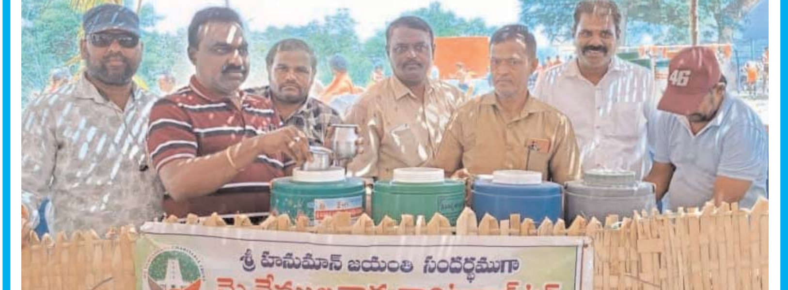
- ఎన్నో సేవా కార్యక్రమాలు.. ఎందరినో ఆదుకునే. మై వేములవాడ చారిటబుల్ ట్రస్ట్. - దాతల సహకారంతో కరోనా సమయం నుండి అన్నార్థులకు ప్రతీరోజు అన్నదానం రాజన్న సిరిసిల్ల/వేములవాడ, ఏప్రిల్ - 23 (అక్షరం స్వాగతం): మై వేములవాడ చారిటబుల్ ట్రస్ట్ ఆధ్వర్యంలో దాతల సహకారంతో అగ్రవహారం ఘోషా ఆంజనేయల స్వామి ఆలయం వద్ద భక్తులకు బుద్ధవేల బటర్ మిల్క్ ప్యాకెట్లు, మరయి 200 మినరల్ కూర్