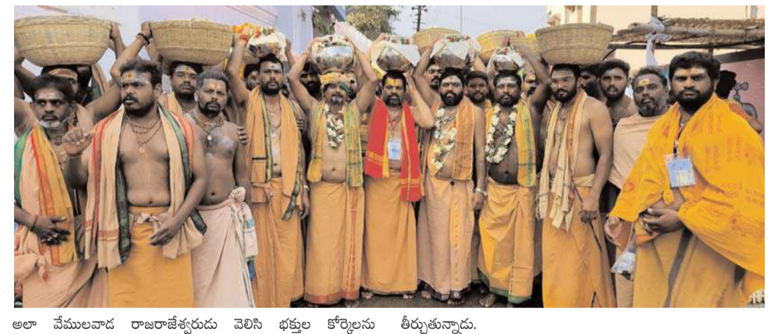
అలా వేములవాడ రాజరాజేశ్వరుడు వెలిసిన భక్తుల కోర్కెలను తీర్చుకున్నాడు.