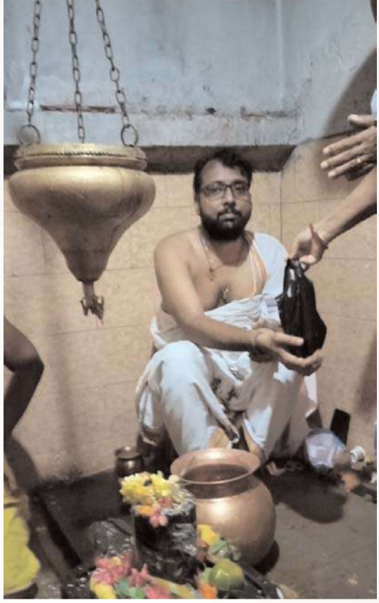
కమిటీ సభ్యులు ప్రత్యేక ఏర్పాట్లు చేశారు.