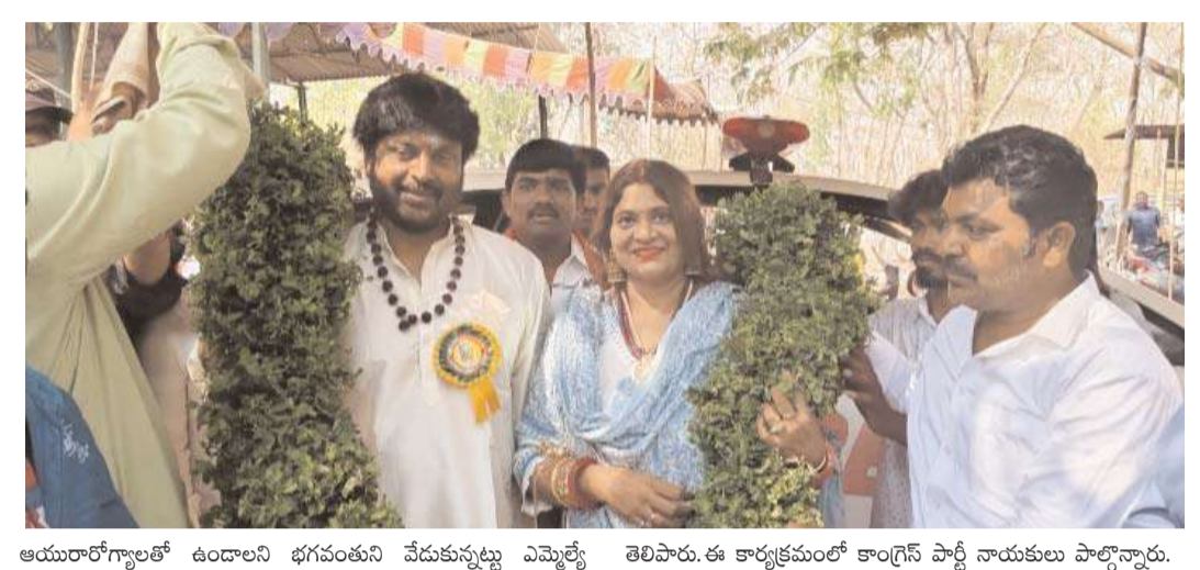
ఆయురారోగ్యాలతో ఉండాలని భగావతుని వేడుకున్నట్లు ఎమ్మెల్యే తెలిపారు. ఈ కార్యక్రమంలో కాంగ్రెస్ పార్టీ నాయకులు పాల్గొన్నారు.