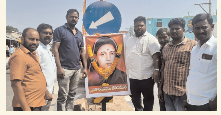
సూర్యాపేట/నేరేడుపల్లి/ఫిబ్రవరి 07 (అక్షరం న్యూస్):-