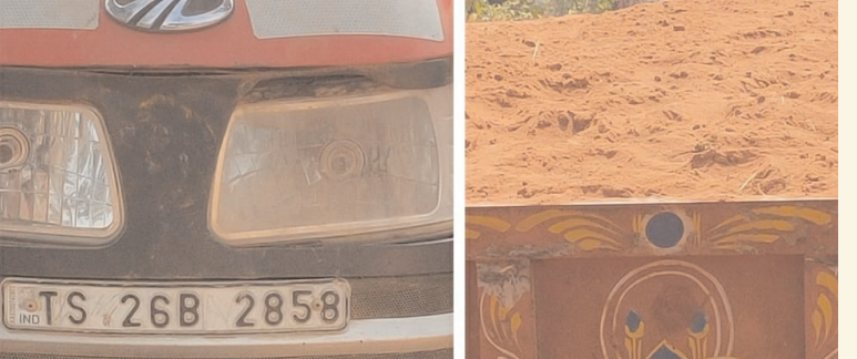
మామిడిపాటి జిల్లా / గంగారం / ఫిబ్రవరి 7 (అక్షరం న్యూస్)

గంగారం మండలం లోని కోమట్లగూడెం గ్రామంలో అక్రమ ఇసుక వ్యాపారం దండా జోరుగా కొనసాగుతుందని గ్రామ ప్రజలు ఆరోపిస్తున్నారు. దీన్ని పర్యవేక్షించవలసిన సంబంధిత అధికారులు నిరక్షణంతో అక్రమ ఇసుక వ్యాపారాలకు కాసుల వర్షం కురిపిస్తుందని గ్రామంలో ని జనాంగం పాపయ్య కుంబ నుండి ఎలాంటి పర్యవేక్ష లేకుండా నిరంతరం రాత్రి పగలు ట్రాక్టర్లతో ట్రాక్టర్ల యాజమానులు డ్రైవర్లు ఇసుక వ్యాపారం జోరుగా కొనసాగిస్తున్నారని గ్రామ ప్రజలు ఆరోపిస్తున్నారు. కోమట్లగూడెం గ్రామంలోని వారంకోటా శ్రీతం జనాంగం పాపయ్య కుంబ దగ్గర ఇసుక ట్రాక్టర్ ను పట్టుకొని కాసుల వర్షం కురిపిస్తున్నారని పదిలిజేతారు వెంటనే సంబంధిత అధికారులు అక్రమ ఇసుక దండా ఆపివేయాలని (పజిలు డిమాండ్ చేశారు.