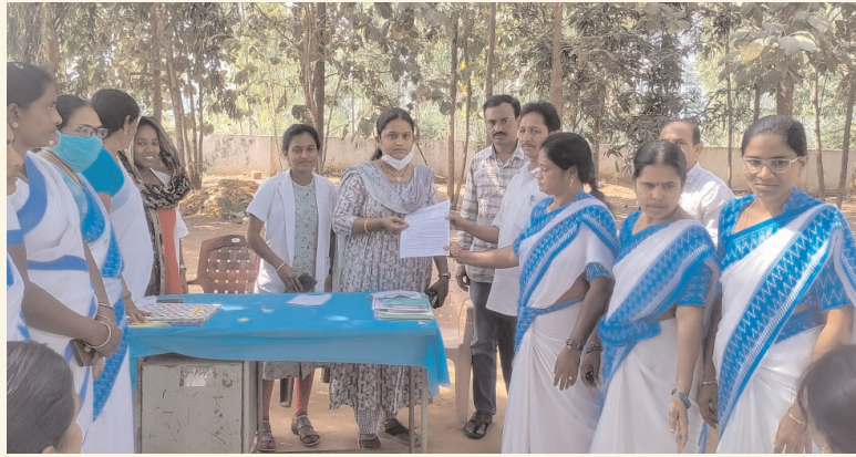
సూర్యాపేట/నేరేడుపల్లి/ఫిబ్రవరి 07 (అక్షరం న్యూస్):-