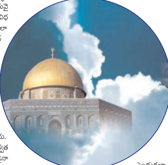
ఎందుకలా చేస్తున్నారు? “అని అడుగగా,

తీరి నిలబడి ఉన్నారు.ప్రవక్త ముహమ్మద్ సల్లల్లాహు అలైహి వసల్లం నాయకత్వంలో వారంతా సమాజ్ ఆచరించారు. ఆ తరువాత అతని ముందుకు, పాలు, నీళ్ళు, మధ్యంతో నిండిన మూడు పాత్రలు తీసుకుని రాబడ్డాయి. ప్రవక్త ముహమ్మద్ సల్లల్లాహు అలైహి వసల్లం పాలను స్వీకరించగా మీరు సమాజ ధర్మాన్ని స్వీకరించారు అని జిబ్రియాల్ దూత సెలవిచ్చారు. ఆ తరువాత ఒక నిచ్చిన తీసుకుని రాబడింది. దానిని అధిరోహించి మొదటి ఆకాశంలోకి వెళ్ళారు. అక్కడ మానవ జాతికి మూలపురుషుడు మొదటి ప్రవక్త అదాం అలైహిస్సలాం కలుసుకున్నారు. ఆయన కుడివైపు చూసి ఆనందిస్తున్నారు. ఎడమవైపు చూసి ఏడుస్తున్నారు.