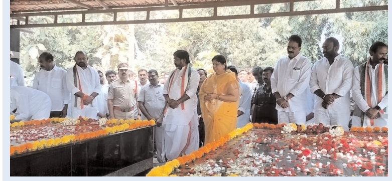
ఖమ్మం/వైరా ఫిబ్రవరి 7 (అక్షరం న్యూస్):