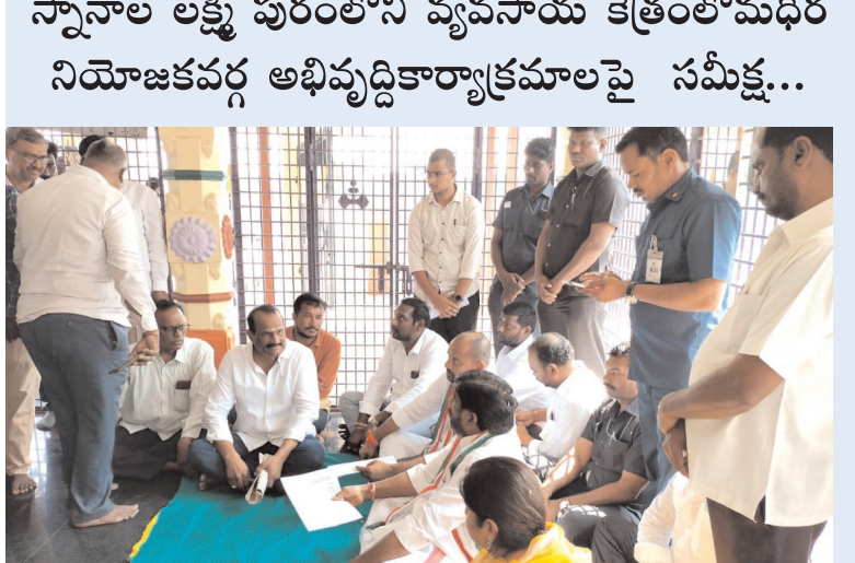
ఖమ్మం/ వైరా ఫిబ్రవరి 7 (అక్షరం న్యూస్):