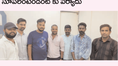
భద్రాద్రి జిల్లా /కొత్తగూడెం /ఫిబ్రవరి.07/ అక్షరం న్యూస్ బీ కొత్తగూడెంలో నిబంధనలు మధ్యం సరఫరా చేస్తు పచ్చని సంసారాలను చిత్తుచేయడమే కాక ఉజ్వల భవిష్యత్ ఉన్న