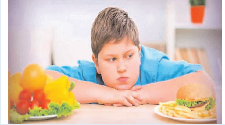
హైదరాబాద్, ఫిబ్రవరి 14 (అక్షరం న్యూస్)

ప్యాకేజ్ల పుణ్య కారణం... పట్టణాన్ని ఏర్పరచిన వెంటనే ప్యాకేజ్ల పుణ్య మన ఆహారంలో భాగంగా మారుతున్నట్లు గుర్తించింది.