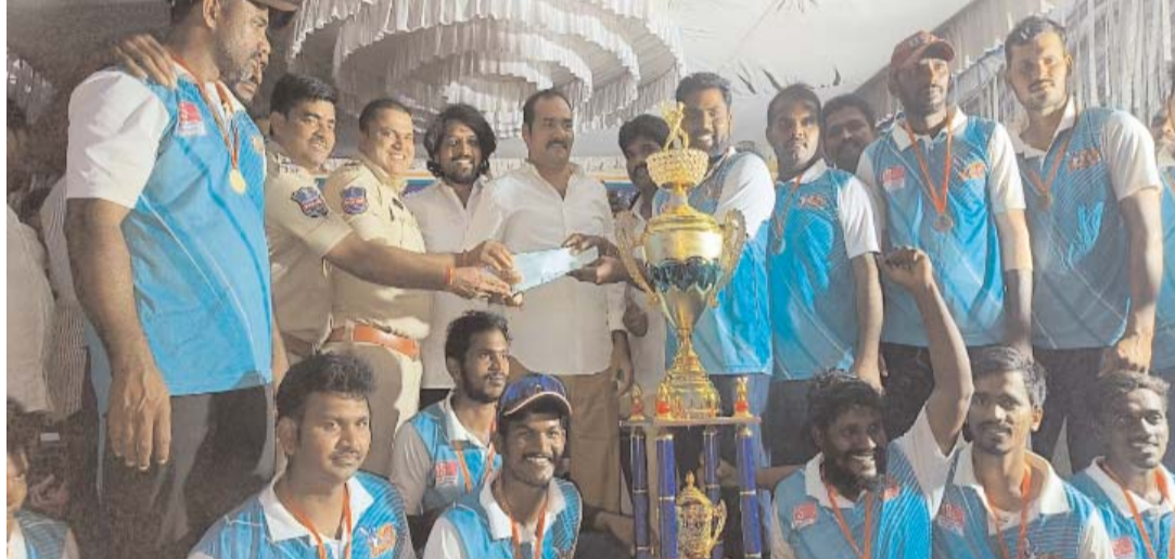
ఈ కార్యక్రమానికి మండల మరియు పట్టణ కాంగ్రెస్ పార్టీ నాయకులు జిల్లా కాంగ్రెస్ నాయకులు హాజరయ్యారు.