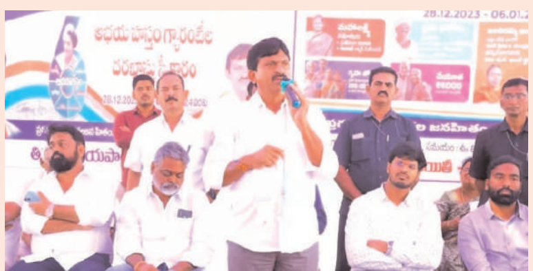
ఖమ్మం జిల్లా / ఖమ్మం రూరల్ / జనవరి 2 /అక్షరం న్యూస్ :/

ప్రభుత్వం ఏర్పడి 48 గంటల్లోనే ప్రజలకు హామీ ఇచ్చిన విధంగా సంక్షేమ పథకాలైన ఆరు గ్యారంటీలు అమలు చేయడం ప్రారంభించామని మంత్రి తిమ్మిరెడ్డి శ్రీనివాస్ రెడ్డి అన్నారు. మంగళవారం తిరువలూరుపాలెం గ్రామంలో జరిగిన ప్రజా పాఠశాల గ్రామసభ కార్యక్రమానికి ముఖ్యఅతిథిగా మంత్రి సీఎంఆర్ అని అన్నారు. సందర్భంగా ఆయన మాట్లాడుతూ పాలకులం కాదని ప్రజలకు సేవ చేసే సేవకులం అని అన్నారు. ప్రజల ఆశీర్వదించి ఏర్పాటుచేసిన ఇందిరమ్మ రాజ్యం ద్వారా ప్రజల గృహాల వద్దకు ప్రభుత్వ అధికారులు వచ్చి ప్రజా సేవలు అందించాలన్నారుని తెలిపారు. ప్రజాపాలన కార్యక్రమంలో ఆరు గ్యారంటీల పథకాల కోసం వచ్చిన ప్రతి దరఖాస్తును పరిశీలించి అర్హులైన ప్రతి ఒక్కరికి ఆరు గ్యారంటీలను అందిస్తామన్నారు. ధనీక రాష్ట్రమైన తెలంగాణను మాజీ ముఖ్యమంత్రి అప్పల ఎమ్మెల్యే సీఎంఆర్ అనేపించారు. ప్రజల సౌకర్యాల కోసం ప్రభుత్వం చూస్తే కడుపు తడుకుపోయిందన్నారు. మాజీ ముఖ్యమంత్రి కేసీఆర్ నిరాజుల పేరుతో అప్పల చేసిన ప్రజాధనం అనేతిహాస్యానంద విమర్శించారు. హామీలన్నీ నెరవేర్చేందుకు ఎంత దూరమైనా వెళతామని అన్నారు. ఈ కార్యక్రమంలో జిల్లా కలెక్టర్ వీపీ గౌతమ్ ఎంపీపీ మంగిలాల ఉద్దిటిని బెల్లెం శీను సర్పంచ్ కొండబాల ఎమ్మెల్యే రేణుక నాయకులు సర్వే రెడ్డి చావా శివరామకృష్ణ ప్రజా ప్రతినిధులు మండల అధికారులు పార్టీ కార్యకర్తలు తదితరులు పాల్గొన్నారు.