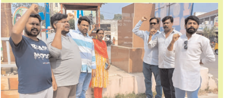
భద్రాద్రి జిల్లా /కొత్తగూడెం/ జనవరి.02/ అక్షరం టౌన్ న్యూస్

ఉమ్మడి జిల్లా వ్యాప్తంగా ఉన్న ఉద్యమకారులు నేటి సభను విజయవంతం చేయాలి తెలంగాణ ఉద్యమకారుల జేపీసీ