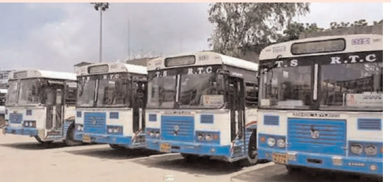
హైదరాబాద్, జనవరి 2 (అక్షరం న్యూస్)

ఆర్టీసీ అద్దె బస్సుల యాజమాన్యం సమ్మెకు సిద్ధమైంది. తమ డిమాండ్లను తక్షణం పరిష్కరించని పక్షంలో 5 నుంచి సమ్మెకు వెళ్తామని హెచ్చరించింది. అద్దె బస్సులకు నిర్వహించిన బెండర్లలో కూడా అద్దె బస్సుల యాజమానులు పాల్గొనలేదు. మహిళల్ని పథకం ద్వారా ఉచిత ప్రయాణం చేస్తున్న మహిళలు తమ బస్సులలో పరిమితికి మించి ప్రయాణిస్తున్నారని, మైలేజ్ తగ్గుతుందని, బస్సులు పాదపథకున్నాయని అదె బస్సుల యాజమానులు అధికార పక్షం చేస్తున్నారు. బస్సులో ప్రతిమితికి మించి ప్రయాణిస్తున్న సమయంలో ఏదైనా ప్రమాదం సంభవస్తే బస్సుదారులపై వర్తించదని, దీంతో బస్సు యాజమాన్యం తీవ్రంగా సస్టెయిన్ చేస్తుంది తెలిపారు.