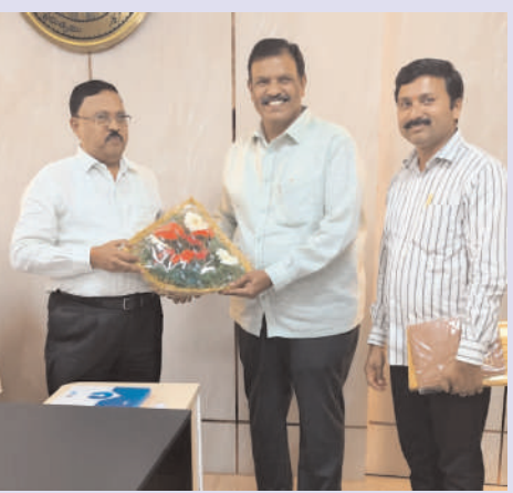
భద్రాద్రి కొత్తగూడెం జిల్లా / కొత్తగూడెం /జనవరి 2/అక్షరం న్యూస్ :