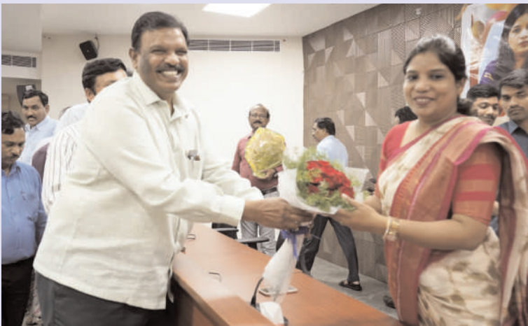
భద్రాద్రి కొత్తగూడెం జిల్లా / కొత్తగూడెం /జనవరి 2/అక్షరం న్యూస్ :