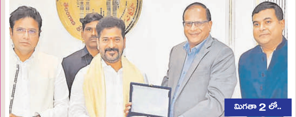
మిగతా 2 లో..

రాష్ట్రంలో రియల్, ఫర్నిచర్, కన్స్ట్రక్షన్ గూడ్స్ వ్యాపార అవకాశాలు పుష్కలం గోడ్రెజ్ ప్రతినిధులతో ముఖ్యమంత్రి రేవంత్ రెడ్డి పాఠశాలలో మొబైల్ టాయిలెట్టు నిర్మిస్తాం మంత్రి కొందా సురేఖతో కోకాకోలా ప్రతినిధులు