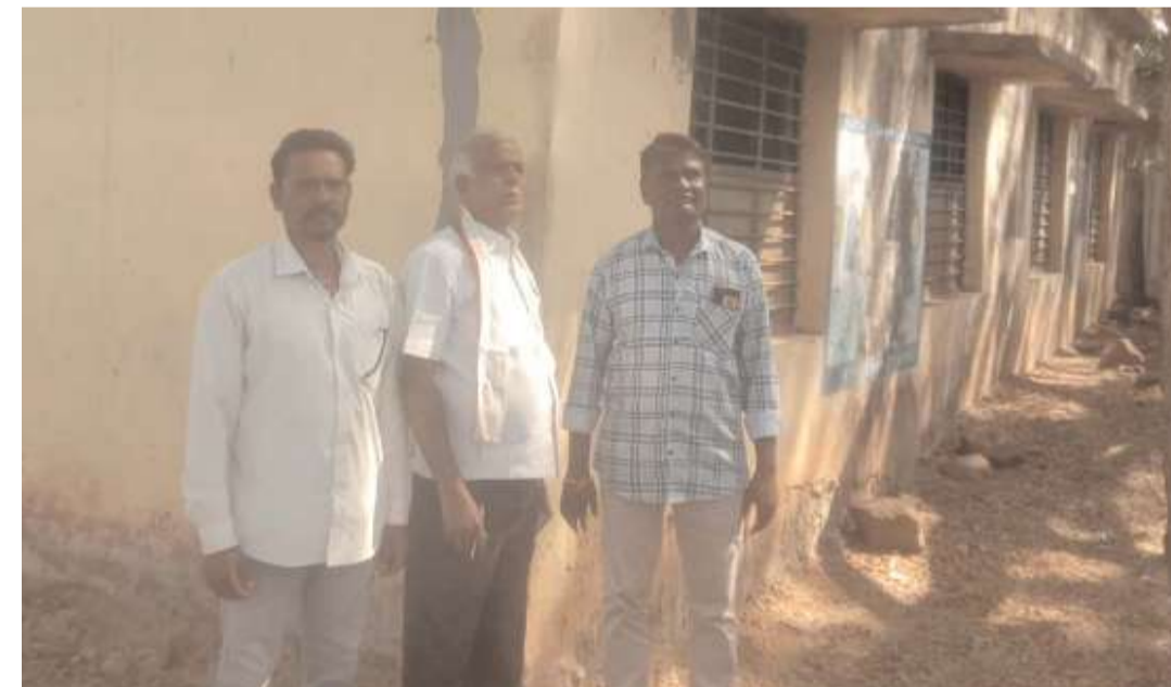
కుమ్మక్కయ్యారని,కోట్ల రూపాయల ప్రజాధనం దండుకుంటున్నా,అధికారులు స్పందించకపోవడం వలన అసమానాలకు దారి తీస్తుంది అన్నారు.అవినీతితో నిండిన బిఆర్ఎస్ ప్రభుత్వానికి ప్రజలు బుద్ధి చెప్పి,కాంగ్రెస్ పార్టీకి వట్టం కట్టారని, ప్రభుత్వం మారిన,అధికారుల తమ పనితీరు మార్చుకోకపోవడం పై బహిరంగంగానే విమర్శించారు. గత ప్రభుత్వ హయాంలో కోట్ల రూపాయల ప్రజాధనం కొల్లగొట్టిన వివిధ శాఖల పనితీరుపై, అవినీతి నాయకులకు అందగా ఉన్న పలు శాఖల అధికారుల అక్రమాలపై త్వరలో, శాఖల వారీగా ఒక పూర్తి స్థాయి నివేదిక తయారు చేస్తున్నామని, పినపాక నియోజకవర్గం ఎమ్మెల్యే పాయం వెంకటేశ్వర్లు దృష్టికి తీసుకువెళ్లి, అవినీతికి పాల్పడ్డ కాంట్రాక్టర్ల నుండి నిధులు రికవరీ చేసి, వారికి సహకరించిన విద్యాశాఖ అధికారులను, ప్రజాధనం కొల్లగొడుతున్న పట్టణంకోసం ఇంజనీరింగ్ శాఖల అధికారులను సస్పెండ్ చేయాలని అన్నారు. ఈ కార్యక్రమంలో ఉపాధ్యక్షులు కొంబత్రిని శ్రీమ, సీనియర్ నాయకులు లక్ష్మయ్య, పోలవోయిన రవి తదితరులు పాల్గొన్నారు.