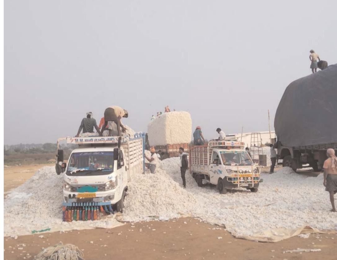
ఉంటున్నట్ల ప్రకారం మాదిరి. ఇప్పటికైనా జిల్లా కలెక్టర్ జోక్యం తీసుకొని వ్యవసాయ మార్కెట్ కి వచ్చే ఆదాయాన్ని పెంచాలని ప్రజలు కోరుకుంటున్నారు.

ఖమ్మం/ తల్లాడ జనవరి 3 (అక్షరంన్యూస్): ఎలాంటి అనుమతులు లేకుండా ఖమ్మంజిల్లా తల్లాడలో పెద్ద ఎత్తున పత్తి కొనుగోలు కేంద్రాలు ఏర్పాటు చేసి ఆ కొనుగోలు కేంద్రాల వద్ద దళారుల దండా కొనసాగుతుంది. ప్రభుత్వ ఆదాయానికి మార్కెట్ శాఖకు రావలసిన లక్షలాది రూపాయల ఆదాయం కోల్పోతుంది. వైరా వ్యవసాయ మార్కెట్ పరిధిలో ఉన్న తల్లాడలో ఎలాంటి నిబంధనలు పాటించకుండా అనుమతులు తీసుకోకుండా సుమారు 20 చోట్ల పత్తి కొనుగోలు కేంద్రాలు ఏర్పాటు చేసి కొనుగోలు చేస్తున్నారు. ఈ పత్తి కొనుగోలు కేంద్రాలకు అనుమతులు లేకుండా కొనసాగుతున్న అధికార యంత్రాంగం ఎవరూ పట్టించుకోవడం లేదు. ఎందుకంటే తల్లాడలో ఏర్పాటుచేసిన అనాధరేఖల్ పత్తి కొనుగోలు కేంద్రాల నిర్వహణకు వ్యవసాయ మార్కెట్ అధికారులకు మద్దతు ఉన్న రహస్య ఒప్పందమే కారణంగా తెలుస్తోంది. అనాధరేఖల్ పత్తి కొనుగోలు కేంద్రాలపై తనిఖీలు నిర్వహించవలసిన అధికార యంత్రాంగం కనుమరుగుచేయడం కూడా కనిపించడం లేదు. పర్యవేక్షించవలసిన మార్కెట్ అధికారులు వారు తల్లాడలో దాగుతున్న అక్రమ పత్తి వ్యాపారం కొనుగోళ్ల వైపు కూడా కనిపించారు. ఎందుకంటే ఇది ఒక పక్క ప్రజాశాఖ సిస్టంకో వ్యాపారులకు, అధికారులకు మద్దతు జరుగుతున్న రహస్య ఒప్పంద పత్తి కొనుగోలు వ్యాపారాలు. తనిఖీలు చేయవలసిన జిల్లా అధికారులు నామమాత్రంగా వచ్చి పోయినము అనే ధోరణిని అవలంబిస్తున్నారు. ఎవరైనా గట్టిగా నిలదీస్తే మేము వచ్చాము, ఆ కొనుగోలు కేంద్రాలను మాతాము, మీపై తేసులు సమోదు చేస్తామని చెప్పి వెళ్ళిపోతున్నారు తప్ప ప్రభుత్వం ఆదాయాన్ని పెంచాలని ఆలోచన అధికారులకు లేదు. అసలు అనుమతులు తీసుకోకుండా ఇంక పెద్ద ఎత్తున పత్తి కొనుగోలు కేంద్రాలు తల్లాడలో కొనసాగుతుంటే పర్యవేక్షించవలసిన అధికారులు ఎందుకు అటు వైపు గుట్టు చప్పుడు కాకుండా