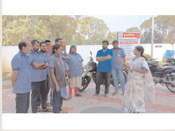
భద్రాద్రి కొత్తగూడెంజిల్లా/కొత్తగూడెం/జనవరి 3/అక్షరం న్యూస్ :