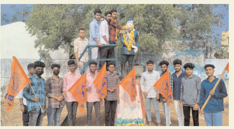
పెద్దపల్లి బోస్ జనవరి 23 అక్షరం న్యూస్