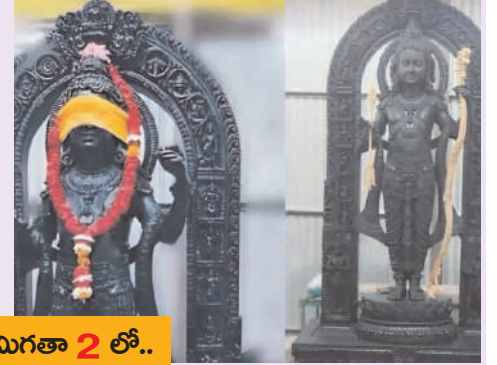
మిగతా 2 లో..

చేతిలో బంగారు ధనస్సుతో ఉన్న బాల రాముడి విగ్రహం. పద్మవీరంపై ముగ్ధమనోహర రూపం ప్రాణప్రతిష్ఠకు ముందే 4.25 అడుగుల ఎత్తైన బాలరాముని దివ్య దర్శనం అయోధ్యకు తరలివస్తున్న భక్తులు