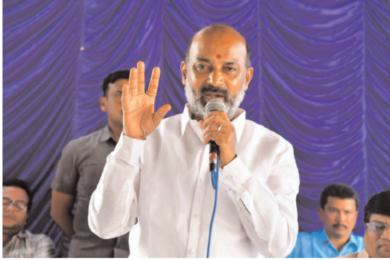
చారిలో వెతుకుంటే రోడ్డుపై కంకుల కాల్పులను ఆమె కనిపించింది. వెహికల్ ఆఫ్ మెమొక్క కంకులు తీసుకున్నా 70% పైసలవిషయంలో.. “సార్ ఫోన్ పే చేయండి” అని ఆ మహిళ చెప్పడంతో ఆశ్చర్యపోయా. ఆమెకు పెద్దగా చదువు రాదు.. అయినా డిజిటల్ ద్వారా లావాదేవీలు జరుపుకోంది. నరేంద్ర మోడి ప్రభుత్వం తీసుకున్న నిర్ణయాలతో ఈరోజు సామాన్యులు కూడా నగదుతో పనిలేకుండా డిజిటల్ లావాదేవీలు జరపగలుగుతున్నారు.

ఎంపీ బండి సంజయ్ కుమార్ ఆ గ్రామస్థులను ఉద్దేశించి అడిగిన ప్రశ్నలవిశ్లో% తద్వారా కేంద్ర ప్రభుత్వ పథకాలపై ప్రజల్లో ఏ మేరకు అవగాహన ఉంది? ఎంత మంది ఆ పథకాల ద్వారా లబ్ధి పొందుతున్నారనే అంశపై ఆరా తీశారు. 70% కేంద్ర ప్రభుత్వం అమలు చేస్తున్న సంక్షేమ పథకాలు పేదలందరికీ అందుతున్నాయా? లేదా? అని తెలుసుకోవడంతోపాటు అర్హతలను పేదలందరికీ వాటి లబ్ధి పేదలందరికీ అందుతున్నాయా? అని అడిగిన భారత్ సంకల్ప యాత్ర కార్యక్రమాన్ని నిర్వహిస్తున్నట్లు బీజేపీ జాతీయ ప్రధాన కార్యదర్శి, ఎంపీ బండి సంజయ్ కుమార్ చెప్పారు. పేద కుటుంబం నుండి వచ్చిన ప్రధానమంత్రి నరేంద్ర మోడి పేదల కష్టాలను తెలిసిన వ్యక్తి అని, అందుకే వారి కోసమే ఎన్నో సంక్షేమ పథకాలను అమలు చేస్తున్నారని తెలిపారు. ఈ సందర్భంగా బండి సంజయ్ ఏమన్నారంటే..