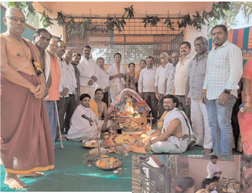
జనగామ జిల్లా/రఘునాథపల్లి/( అక్షరం న్యూస్) డిసెంబర్ 11 :