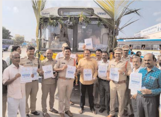
రాజన్న సిరిసిల్ల /వేములవాడ, డిసెంబర్ - 09 (అక్షరం న్యూస్):