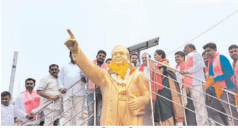
రాజన్న సిరిసిల్ల/ స్టాపర్/ డిసెంబర్ -6 (అక్షరం స్టూప్):