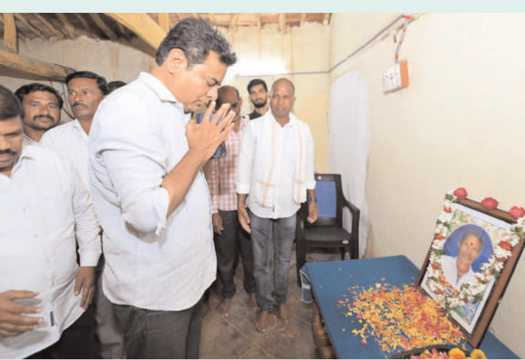
రాజన్న సిరిసిల్ల/గంభీరాపుపేట/డిసెంబర్ 6 (అక్షరం న్యూస్)