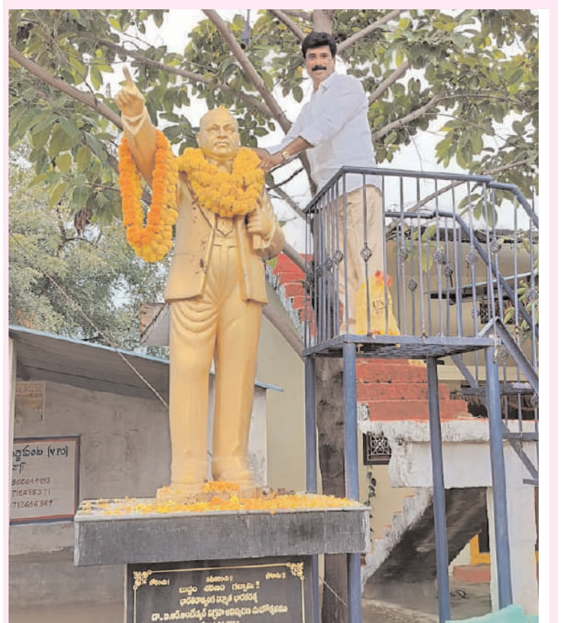
రాజన్న సిరిసిల్ల/ముస్తాబాద్/డిసెంబర్-06(అక్షరం న్యూస్)