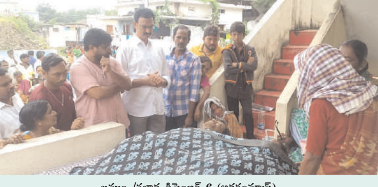
ఖమ్మం /తల్లాడ డిసెంబర్ 6