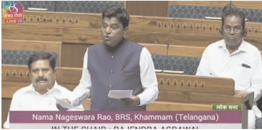
తెలంగాణ అసెంబ్లీ సీట్ల సంగతి తెల్లయింది..