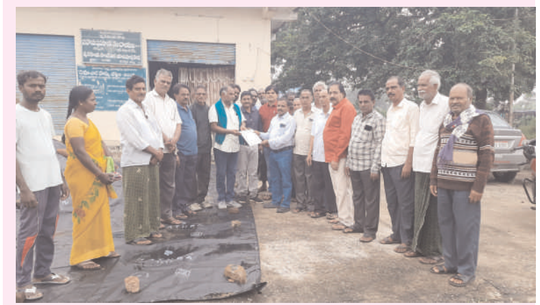
ఖమ్మం/ వైరా డిసెంబర్ 6 (అక్షరంన్యూస్)

తెలంగాణ రైతు సంఘం ఆధ్వర్యంలో పంటల పరిశీలన, వ్యవసాయ అధికారులకు వివరణ ..