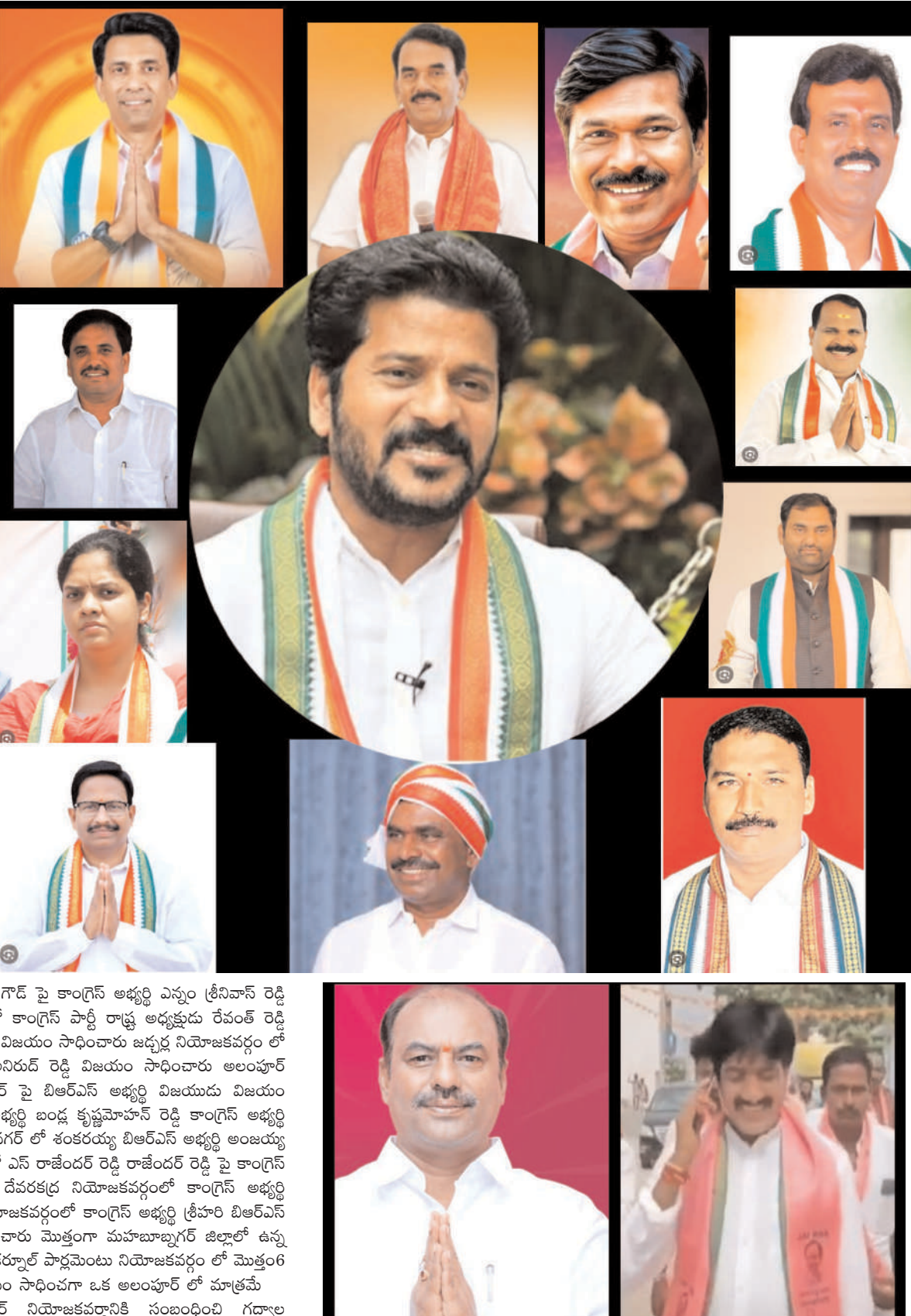
తెలియజేస్తూ ప్రజలు జిల్లా వ్యాప్తంగా బాణాసంచ పెట్టి స్ట్రీలు పంచుకుని విజయోత్సవ సంబరాలు నిర్వహించుకున్నారు.