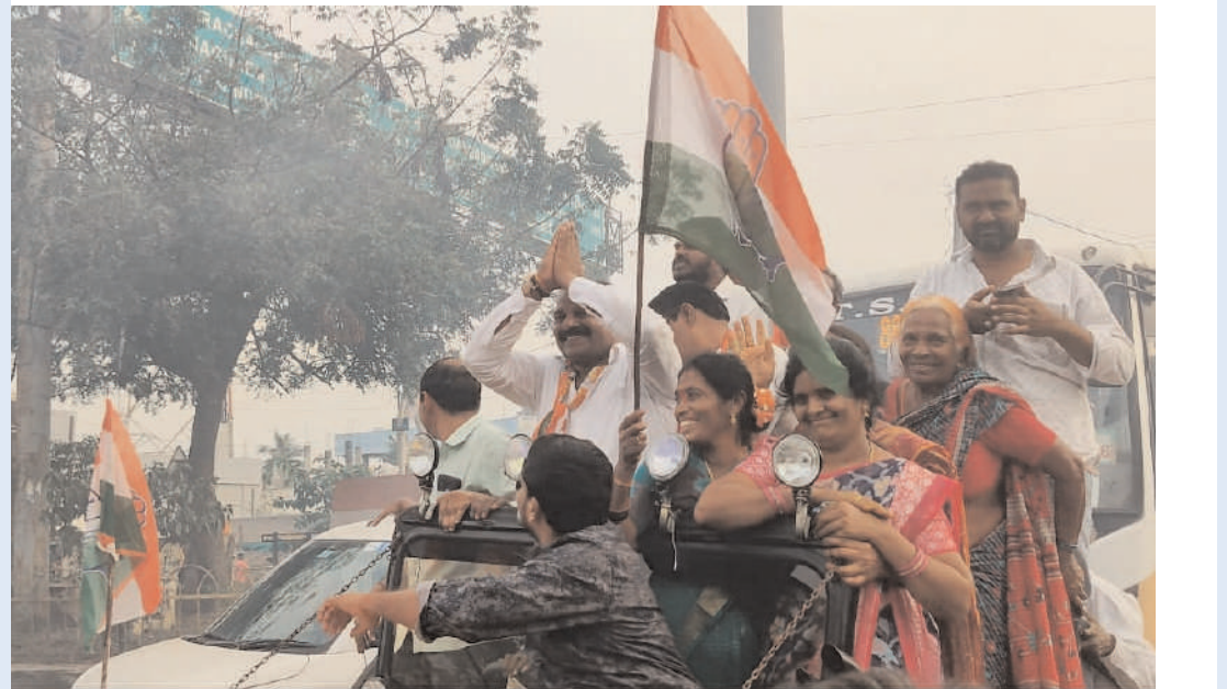
భద్రాద్రి కొత్తగూడెం, డిసెంబర్ 3 (అక్షరం న్యూస్)