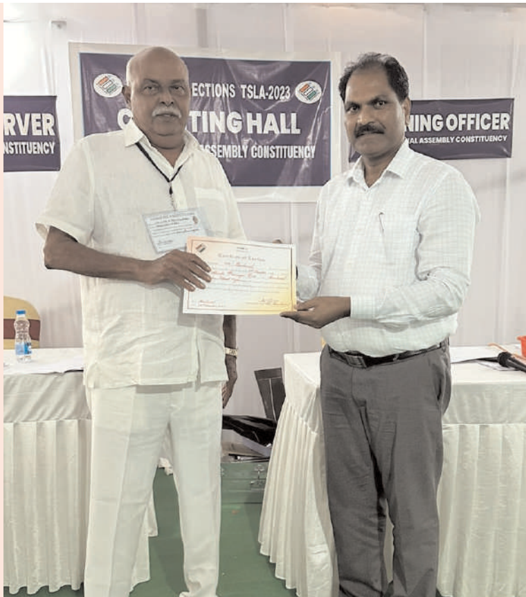
నియోజకవర్గాలలో పాలన తీరును సైతం మార్చాలని ఇంకా మంచి ప్రజా పాలన జరగాలంటే మార్పు రావాలని కాంగ్రెస్ పార్టీ యొక్క చేతి గుర్తుకు ఓటు వేసిన ఈ ఓటరు మహోదయలు వాళ్ల యొక్క అమూల్యమైన తీర్పును ఓట్ల రూపంలో భారత రాజ్యాంగ బద్ధంగా తెలిపారని చెప్పడంలో అసలు సందేహం లేదు.