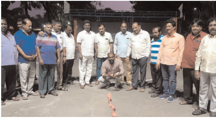
జ్యోతి నగర్ సపంచర్ 3 పెద్దపల్లి జిల్లా అక్షరం న్యూస్