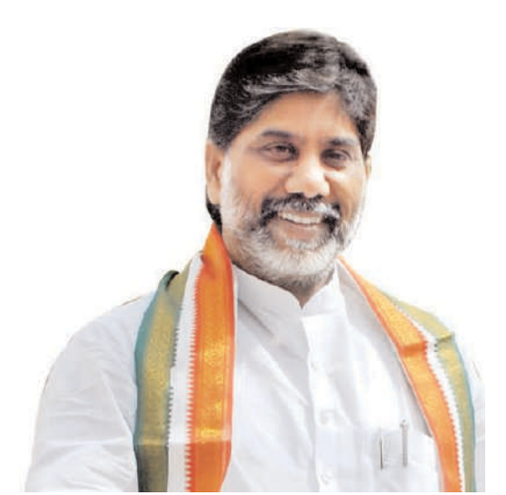
భయ్యం, డిసెంబర్ 3

మధిర అసెంబ్లీ స్థానం నుండి కాంగ్రెస్ పార్టీ అభ్యర్థిగా పోటీ చేసిన స్థానిక శాసనసభ్యులు రాష్ట్ర కాంగ్రెస్ శాసనసభ పక్ష నేత మల్లు భట్టి విక్రమార్క తన