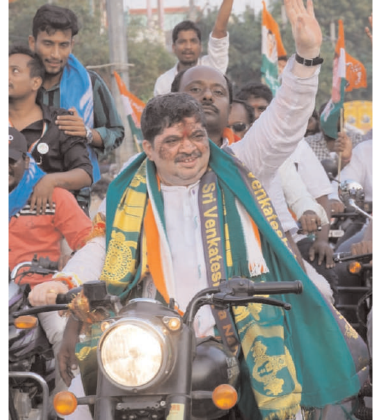
ఎక్కడ వేసిన గొంగడి అక్కడే అన్న చందంగా హుస్సాబాద్ లో సమస్యలు ఉన్నాయన్నారు సమస్యలను అన్నిటిని కూడా ఒక్కొక్కటిగా పరిష్కరించుకుంటామని నమ్మకం తనకుందన్నారు.