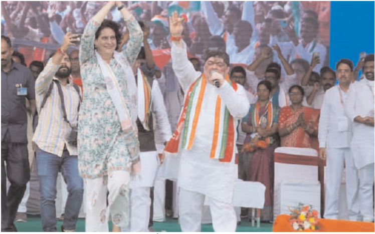
హుస్సాబాద్/సిద్దిపేట, డిసెంబర్ 03