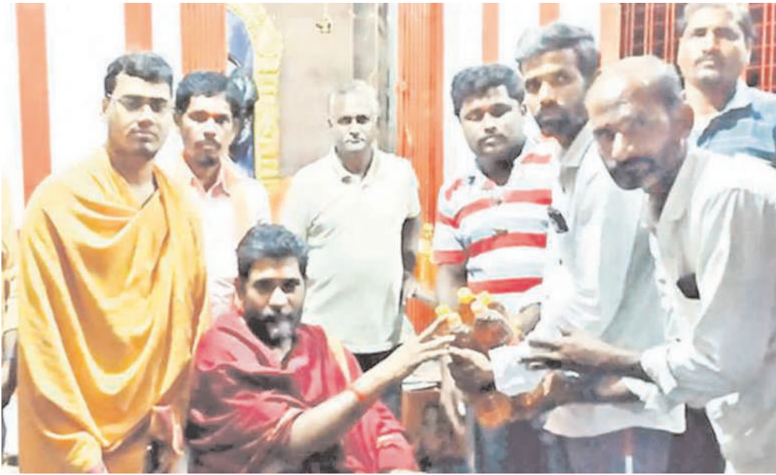
కార్యక్రమాల మధ్య కొనసాగుతున్నాయి.