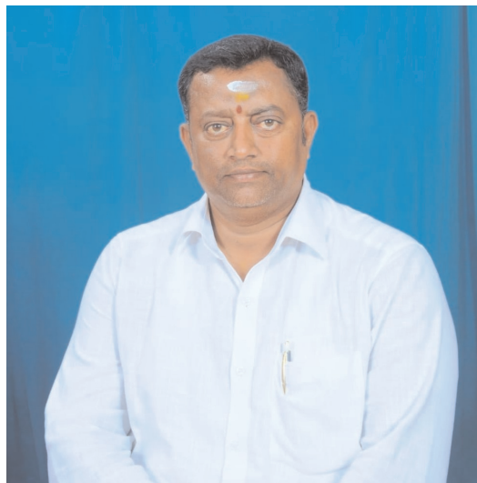
కొట్లాడిన చిన్న పత్రికలను వేములవాడ పట్టణంలో

కొంతమంది రాజకీయ నాయకులు చిన్నచూపు చూస్తున్నారని ఆరోపించారు. చిన్న పత్రికలకు అండగా నిలవాల్సిన రాజకీయ నాయకులు పెద్ద పత్రికలకు కొమ్ముకాయారన్నారు, సమాజంలో చిన్న పత్రికల పాత్ర ఎంతో కీలకమని, చిన్నపత్రికలలోనే ఎక్కువ సంఖ్యలో వార్తలు ప్రచురితమవుతాయన్న విషయాన్ని గుర్తుంచుకోవాలని తెలిపారు. ఎంతో శ్రమించి, అన్ని రంగాలకు చెందిన వార్తలను ప్రచురణ చేస్తున్న చిన్న పత్రికల పాత్రికేయులకు రాజకీయ నాయకులు అన్యాయం చేస్తున్నారని, చిన్న పెద్ద తేడా లేకుండా పత్రికల సమ ప్రాధాన్యత ఇవ్వాలని సూచించారు. చిన్న పత్రికలకు అండగా జేపీఎన్ ఎన్ సంఘం ఎల్లప్పుడూ ఉంటుందని తెలిపారు. ఇప్పటికైనా పద్ధతి మార్చుకోని చిన్న పెద్ద పత్రికలనే తేడా లేకుండా ప్రతి పత్రికకు న్యాయం చేశారేలా చూడాలని కోరారు.