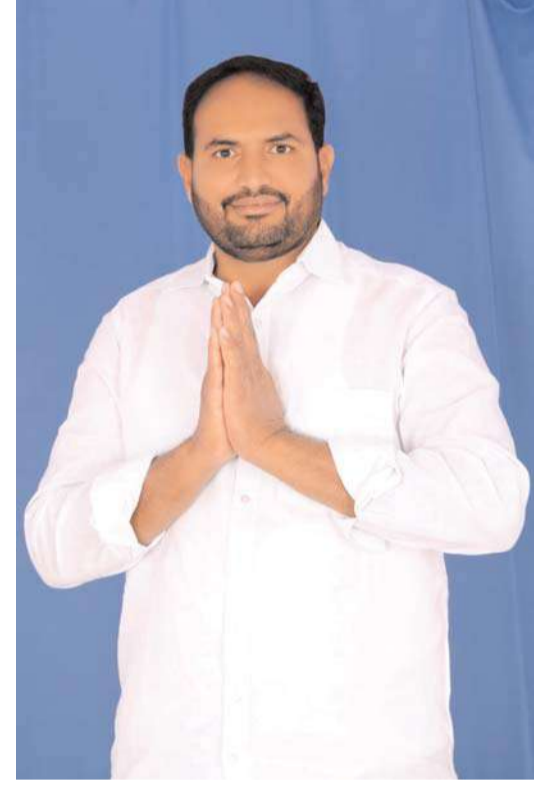
కల్పించిన ఘనత కూడా కేసీఆర్ దేవని సృష్టం చేశారు. గతంలో