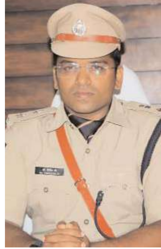
రహదారి శబ్దాలను వివలన్నారు. మీ లేనే లేనే డ్రైవింగ్ చేయాలని, పొగమంచు ద్వారా డ్రైవింగ్ చేస్తున్నప్పుడు తక్కువ దృశ్యమానతతో, ఎవరైనా లేనట్లు ఎప్పుడు

-ఎస్సీ వినిక్.జి భద్రాద్రి కొత్తగూడెం జిల్లా/కొత్తగూడెం/డిసెంబర్ 26/అక్షరం స్వర్ణ : పొగమంచు కారణంగా రోడ్డు కనిపించకపోవడంతో రోడ్డు ప్రమాదాలు ఎక్కువగా పెరుగుతున్నాయని, ప్రమాదాలు జరగకుండా తీసుకోవాల్సిన జాగ్రత్తల గురించి ఎస్సీ వినిక్ జి జి ప్రకటనలో తెలిపారు. హెడ్లైట్లను తక్కువ బీం పై సెట్ చేయాలని, దృశ్యమానత చాలా తక్కువగా ఉన్నప్పుడు పొగమంచులో డ్రైవింగ్ చేయడం చాలా కష్టంగా ఉంటుందని, తక్కువ బీమ్లో హెడ్లైట్లను అమర్చడం దీనికి సహాయపడుతుందన్నారు. హై-బీమ్ పై హెడ్లైట్లను ఉపయోగించడం మంచిది కాదని, పొగమంచు వాస్తవానికి ఈ కాంతిని తిరిగి ప్రతిబింబిస్తుందని, డ్రైవర్ దృష్టికి ఆటంకంకాల్గిస్తుందని, 100 మీటర్ల కంటే తక్కువగా ఉంటే, కారు ఫాగ్ ల్యాంప్లను ఆన్ చేయడం మంచిదన్నారు. విజిబిలిటీ చాలా తక్కువగా ఉన్నప్పుడు పరిసరాలను అంచనా వేయడం కష్టంగా ఉంటుందని, వేగంగా ప్రయాణిస్తున్నట్లయితే రహదారి పరిస్థితులు వెంటనే అర్థం కాకపోవచ్చన్నారు. సహేతుకమైన వేగంతో డ్రైవింగ్ చేయడం వల్ల రోడ్డు, ట్రాఫిక్ నకు ప్రతిబంధించడానికి, అవసరమైతే సమయానికి వాహనాన్ని ఆపివేయడానికి మిమ్మల్ని మెరుగ్గా సన్నద్ధం చేస్తుంది. ఏదీ ఏమైనప్పటికీ, దృశ్యమానత పరిమితిని మించి నడిపితే ఎదురుగా ఎవరైనా ఉన్నారో లేదో నిర్ధారించడం అసాధ్యం, దీనిని పరిగణించకపోవడం ఘర్షణలకు దారితీయవచ్చన్నారు. కనిపించని ట్రాఫిక్ వినికడి ద్వారా గ్రహించే ప్రయత్నం చేయాలన్నారు. పొగమంచు వాతావరణంలో డ్రైవింగ్ చేస్తున్నప్పుడు చేపులు గొప్ప అస్తిగా ఉంటాయి. దట్టమైన పొగమంచు సమయంలో మీ దృశ్యమానత దెబ్బతినవచ్చన్నారు. బ్రెడ్లు, హోర్స్ శబ్దాలు కనిపించని వాహనాల నుండి దూరాన్ని అంచనా వేయడంలో మీకు సహాయపడతాయిన్నారు. కాబట్టి పొగమంచులో డ్రైవింగ్ చేస్తున్నప్పుడు మీ వాహనంలో సంగీతాన్ని నిలిపివేయాలని,