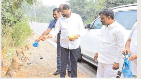
ఖమ్మం/ తల్లాడ నవంబర్ 14 (అక్షరంస్వ్యాస్):

ఆకలితో నకనక లాడుతున్న వానరుల(కోతులు) కు రాజ్యసభ సభ్యులు వద్దిరాజు రవిచంద్ర అరటిపండ్లు అందించారు. ఇల్లందు నుంచి కొత్తగూడెంకు కారులో వెళుతున్న ఎంపీ రవిచంద్రకు రోడ్డుపై ఆకలితో అటూఇటూ పరుగులు పెడుతున్న, ఆహారం కోసం ఎదురుచూస్తున్న కోతులకు సరిపోను అరటిపండ్లు వేశారు.