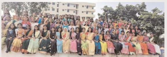
సుల్తానాబాద్, (పెద్దపల్లి జిల్లా), నవంబరు 14, అక్షరం స్వ్యాస్: