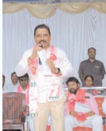
గోదావరిఖని ప్రతినిధి/పద్మవల్లి/నవంబర్ 13/అక్షరం న్యూస్: తెలంగాణ