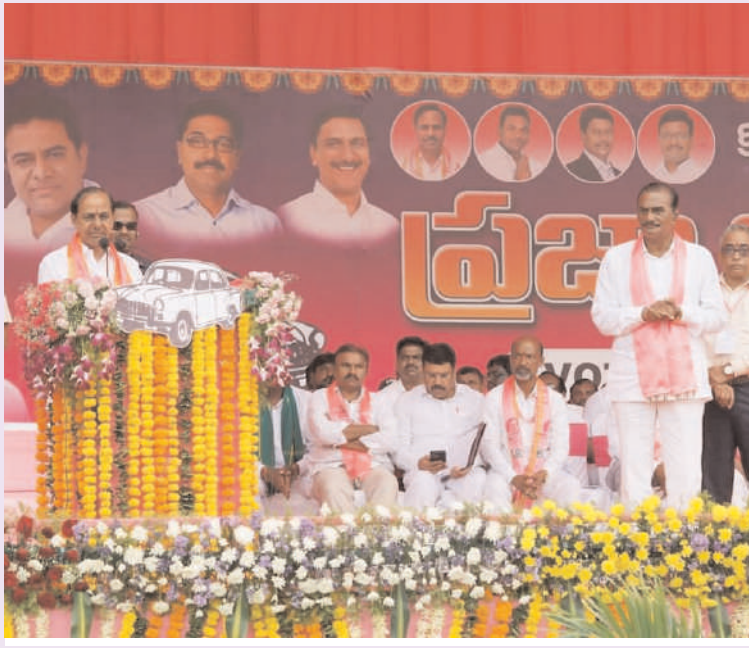
ఖమ్మం, నవంబర్ 5 (అక్షరం స్పెషల్)

అసెంబ్లీ ఎన్నికల ప్రచారంలో బీఆర్ఎస్ జోరు కొనసాగుతున్నది. ముఖ్యమంత్రి కేసీఆర్ స్వయంగా వివిధ జిల్లాల్లో ప్రచార సభలతో హోరెత్తిస్తున్నారు. ఆదివారం ఖమ్మం పట్టణంలో జరిగిన ప్రజా ఆశీర్వాద సభలో సీఎం కేసీఆర్ ప్రసంగించారు. ఈ సందర్భంగా బాగా ఆలోచించి ఓటు హాక్కు వినియోగించుకోవాలని ఓటర్లను కోరారు. దేశంలో ఇంకా ప్రజాస్వామ్య పరిణతి రాలేదని, ప్రజాస్వామ్య పరిణతి సాధించి దేశాన్ని అభివృద్ధిలో దూసుకుపోతున్నాయని సీఎం అన్నారు. దేశంలో ప్రజాస్వామ్య పరిణతి కోసం యువత కృషి చేయాలని సూచించారు.