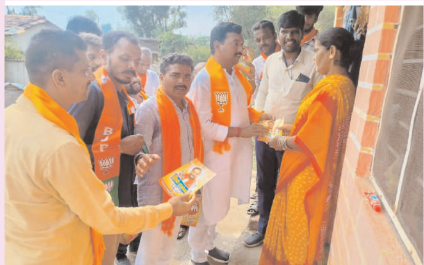
దుబ్బాక/సిద్దిపేట్, నవంబర్ 04, (అక్షరం న్యూస్ )