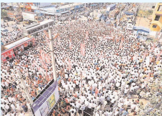
ప్రచారం చివరి రోజున సీఎం కేసీఆర్ గజ్వేల్లో ఎన్నికల ప్రచారాన్ని ముగించారు.

హైదరాబాద్, నవంబర్ 28 (అక్షరం స్పెషల్) : తెలంగాణ అసెంబ్లీ ఎన్నికలకు ప్రచారం ముగిసింది. దాదాపు నెల రోజుల పాటు ప్రచారం కొనసాగింది. పోలింగ్ ముగిసే సమయానికి 48 గంటల ముందుగా ఎన్నికల ప్రచారం ముగించాలనే ఎన్నికల సంఘం నిబంధన కారణంగా, మంగళవారం సాయంత్రం 5 గంటలకు ప్రచారం ముగిసింది. దీంతో రాష్ట్ర వ్యాప్తంగా ఆయా పార్టీల మైకులు మూగబోయాయి. 5 గంటలకు ముందే పార్టీల అభ్యర్థులు తమ ప్రచారాన్ని ముగించుకున్నారు. చివరి రోజైనా మంగళవారం రాష్ట్ర వ్యాప్తంగా ఆయా పార్టీలు బైక్ ర్యాలీలు, రోడ్ షోలు భారీగా నిర్వహించి, ఓటర్లను ఆకట్టుకునే ప్రయత్నం చేశారు. ఇక రాష్ట్రంలోని 106 నియోజకవర్గాల్లో సాయంత్రం 5 గంటలకు ప్రచారం ముగియగా, 13 నియోజకవర్గాల్లో మాత్రం సాయంత్రం 4 గంటలకే ముగిసింది. ఈనెల 3వ ఎన్నికల నోటిఫికేషన్ వెలువడగా ఈనెల 30వ ఎన్నికలు జరగనున్నాయి. ఇక బీఆర్ఎస్ అధ్యక్షుడు, ముఖ్యమంత్రి కే చంద్రశేఖర్ రావు, వర్కింగ్ ప్రెసిడెంట్, మంత్రి కేటీఆర్, మంత్రి హరీష్ రావు, ఎమ్మెల్యే కల్వకుంట్ల కవితలు ప్రచారాన్ని హెచ్చరించారు. ఎన్నికల