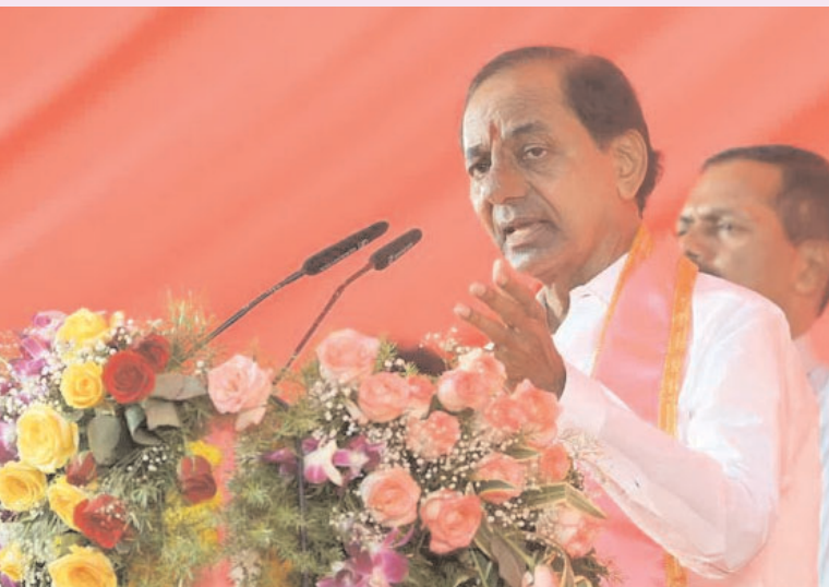
హైదరాబాద్, నవంబర్ 28 (అక్షరం స్పెషల్)

96 ప్రజా ఆశీర్వాద సభలతో సీఎం కేసీఆర్ రికార్డు రోజుకు నాలుగు నియోజకవర్గాల్లో పర్యటిస్తూ.. ఇందిరమ్మ రాజ్యం అంత దరిద్రపు రాజ్యం ఇంకోటి లేదు.. అసుంటి రాజ్యం మళ్లీ గావాలూ 24 ఏండ్లుగా తెలంగాణనే ఆశగా, శ్వాసగా బతుకుతున్నా.. సీఎం కేసీఆర్