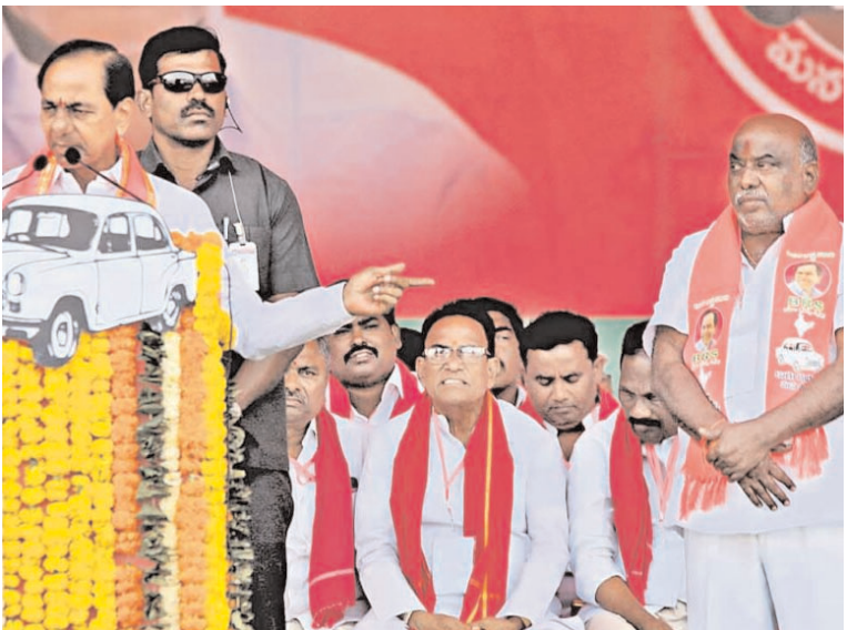
50 ఏండ్ల పాలన, బీఆర్ఎస్ 10 ఏండ్ల పాలనను బేరీజు వేయాలి. దీనిపై బీఆర్ఎస్ నాయకులు, కార్యకర్తలు గ్రామాల్లో చర్చ పెట్టాలి.

పింఛన్సు రూ.5 వేలకు పెంచుతాం.. బీఆర్ఎస్ పుట్టిందే తెలంగాణ రాష్ట్ర సాధన కోసమని, అలుపెరగని పోరాటం చేసి రాష్ట్రాన్ని సాధించామని ఇదంతా కండ్ల ముందే జరిగిందని సీఎం కేసీఆర్ వివరించారు. మొక్కుబడిగా కాకుండా సామాజిక, ప్రభుత్వ బాధ్యతగా విధించితులు, వృద్ధులు, దివ్యాంగులకు పింఛన్లు ఇస్తున్నామని, ఎన్నికల తరువాత ఆ మొత్తాన్ని రూ.5 వేలకు పెంచుతామని హామీ ఇచ్చారు. కేసీఆర్ కిట్, కల్యాణలక్ష్మి, కందివెలుగు, అమ్మ ఒడి వాహనాలను ఇలా అనేక సంక్షేమ కార్యక్రమాలను అమలు చేస్తున్నామని ఉదహరించారు. వీటి తీరువా రద్దు చేశామని, రైతుబంధు, రైతుబీమా, 24 గంటల కరింటల్ సరఫరా చేస్తున్నామని, ప్రభుత్వమే ధాన్యం కొనుగోలు చేస్తున్నదని వివరించారు. వ్యవసాయాన్ని స్త్రీకరించడంతో రాష్ట్రం బాగుపడిందని చెప్పారు. ప్రజాస్వామ్యంలో ప్రజలకు ఉండే ఆయుధం ఓటు. రాయ్డో, రత్నమేడో గుర్తించి ఓటియాలి. అప్పుడే ప్రజలకు లాభం జరుగుతుంది. మంచి ప్రభుత్వం రాకుంటే ప్రజలకు చెడు జరుగుతుంది. కాంగ్రెస్