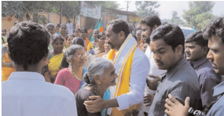
దుబ్బాక/సిద్దిపేట్,సవంబర్ 11(అక్షరం న్యూస్)