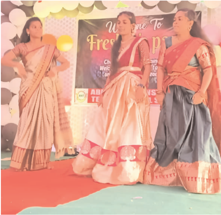
భద్రాద్రి కొత్తగూడెం జిల్లా /నవంబర్ 11