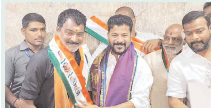
రంగారెడ్డి / రాజేంద్రనగర్ / గండిపేట్ / సవంబర్ 11/ అక్షరం న్యూస్ :