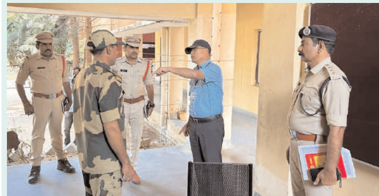
దుబ్బాక/సిద్దిపేట, సవంబర్ 11(అక్షరం న్యూస్)