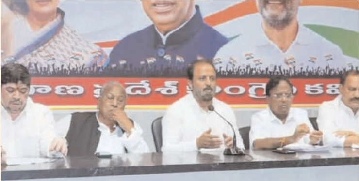
హైదరాబాద్, నవంబర్ 11(అక్షరం న్యూస్):